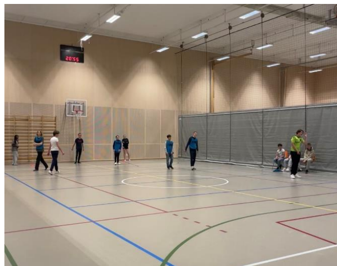
Bildet viser et eksempel på en aktivitet som ofte går igjen på KRIK - dansk kanonball.

I 2024 har vi så langt planlagt å ha en turnering, en skitur til Kongsberg og en tur med styrene i KRIK og D41.