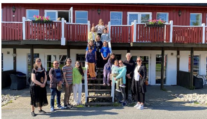
Kortur til Kragerø, foto: Jostein Grolid og privat