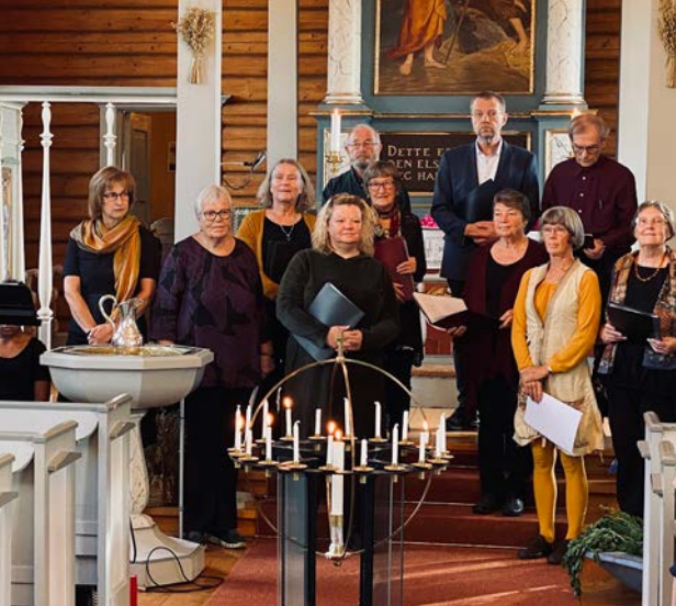
Kroer AdHoc.