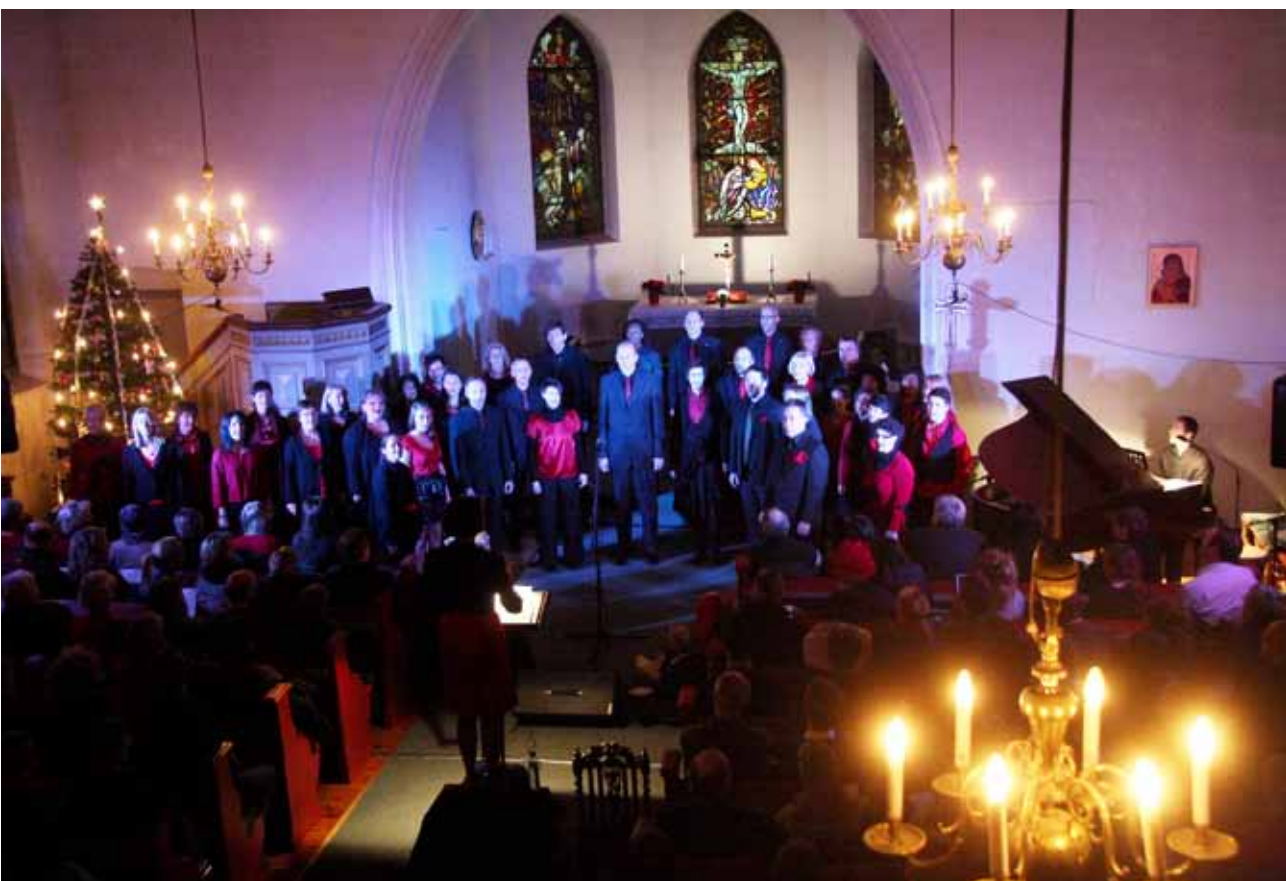
Fullsatt kirke sent lille julaften. ÅsEnsemblet innbyr til julekonsert kvelden før kvelden.