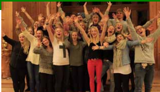
Fra øvelsen 6. november, der Ås Ten Sing hadde besøk av Ten Sing Norway.

– Det beste så langt har helt klart vært showpremieren. Det å ha sentrale roller i en så viktig produksjon gav en ekstrem mestingsfølelse. Vi er veldig stolte av det vi har fått til. Nå gleder oss til å reise landet rundt