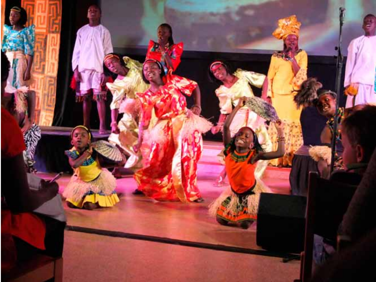
Barnekoret Watoto fra Uganda leverte en livsbejænde og drivende god forestilling på troens grunn i Arbeidskirken 22. oktober. Når disse barna kan, burde vi også kunne så mye mer!