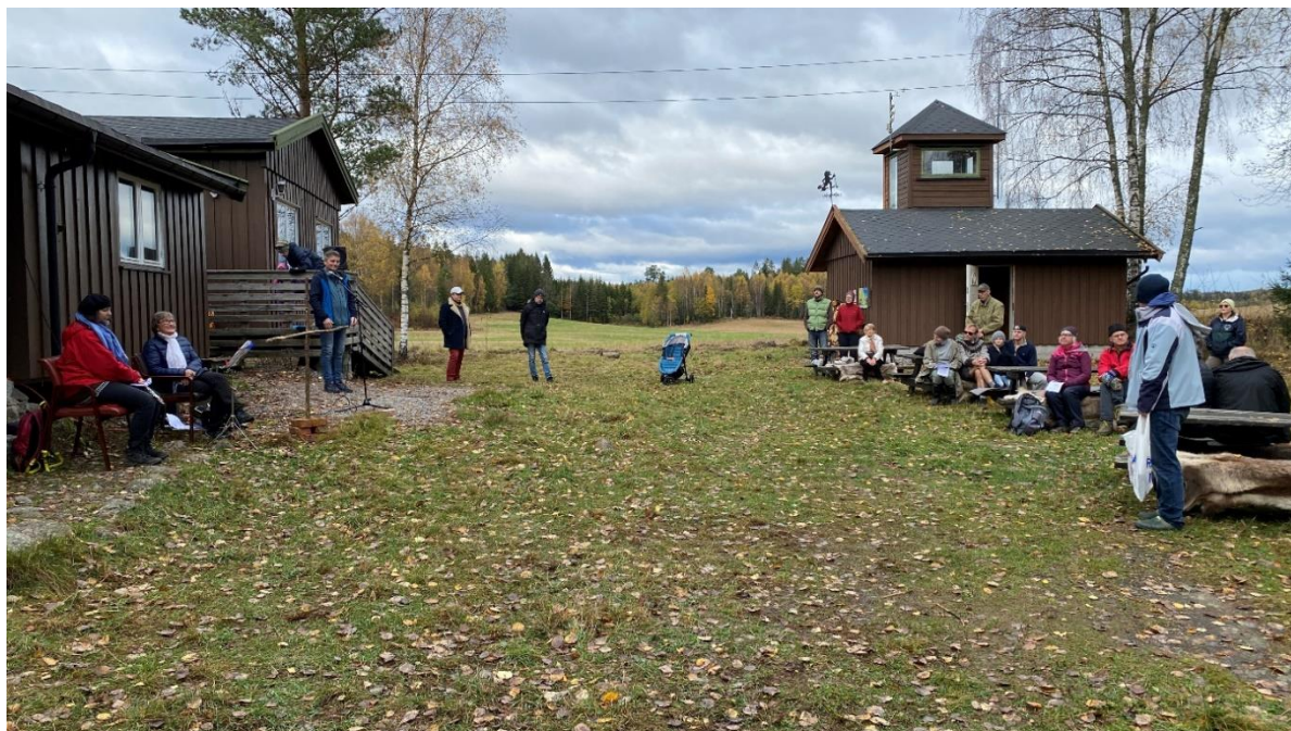
Friluftsgudstjeneste på Trampen.

Videre kommer vi til å jobbe for å beholde, utvide og utvikle nye spennende gudstjenester for våre menigheter.