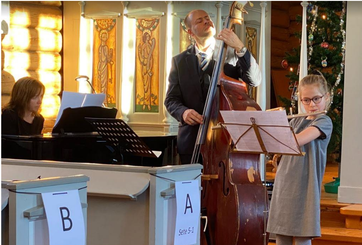
Familietriø på julaften.