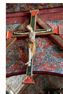
KRUSIFIKSET I RØLDAL