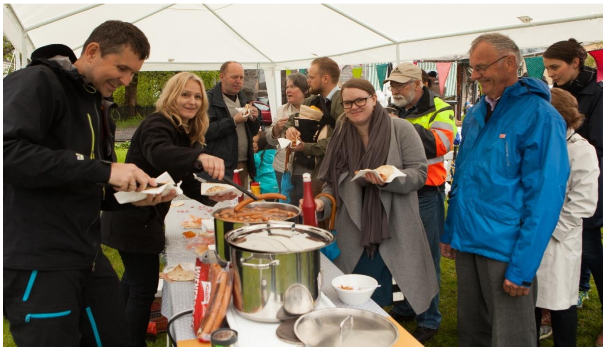
Mange frivillige fra nabolaget bidro på Årstad kirkecaffestival 22.mai.

Årstad menighet har nesten 200 frivillige som gjør en fantastisk innsats. Noen bidrar ofte, andre deltar på sin faste oppgave en gang i året. Uten deres innsats ville menighetens tilbud vært svært begrenset.