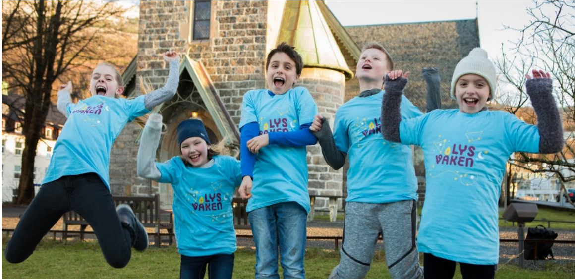
10-åringene gledet seg til «Lys Våken» og overnatting i kirken i januar 2017.