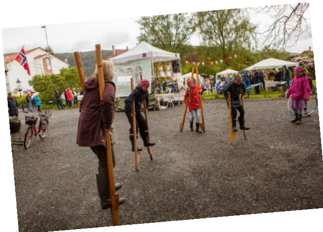
soknepresten (t.v) på stylter på Årstad kirkecaffestival.