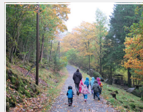
Turdag i nærmiljøet