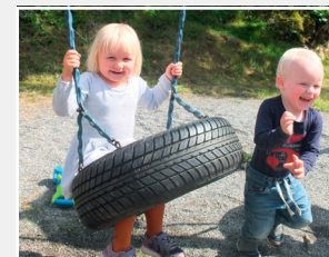
Turdag på lekeplassen