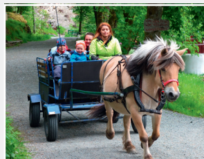
Turdag til Langegården

Vi har en fast turdag i uken, da er tanken at vi skal på en tur utenfor barnehagen. I en barnehage med barn mellom 1 og 6 år sier det seg selv at barnas mestrings- og utviklingsnivå varierer.