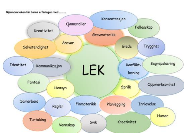
EGENLEDELSESHJULET VISER HVA BARN LÆRER I LEK:

Leken skal ha en sentral plass i Tripp-trapp åpen barnehage. Leken er en typisk væremåte for barn og har egenverdi; den er barns egenaktivitet, indre motivasjon, glede og selvstyring, noe barn driver spontant med for sin egen skyld. Lek har også en annen viktig funksjon – det er et redskap for samhandling, læring og utvikling. Leken stimulerer alle sider ved barns utvikling; kognitiv, språklig, emosjonell, sosial, moralsk og motorisk. Leken er med på å utvikle problemløsningsevne, kreativitet og lærer barnet om hvordan verden fungerer både fysisk og sosialt. Når barn leker med andre barn eller voksne vil de lære hvordan ulike mennesker reagerer på ulike situasjoner som skjer. Her lærer de seg også å dele, forhandle om reglene leken skal ha og hvem som skal gjøre hva. Gjennom leken kan barnet utforske verden rundt seg, prøve og feile, oppleve mestring og bearbeide følelser, opplevelser og inntrykk.