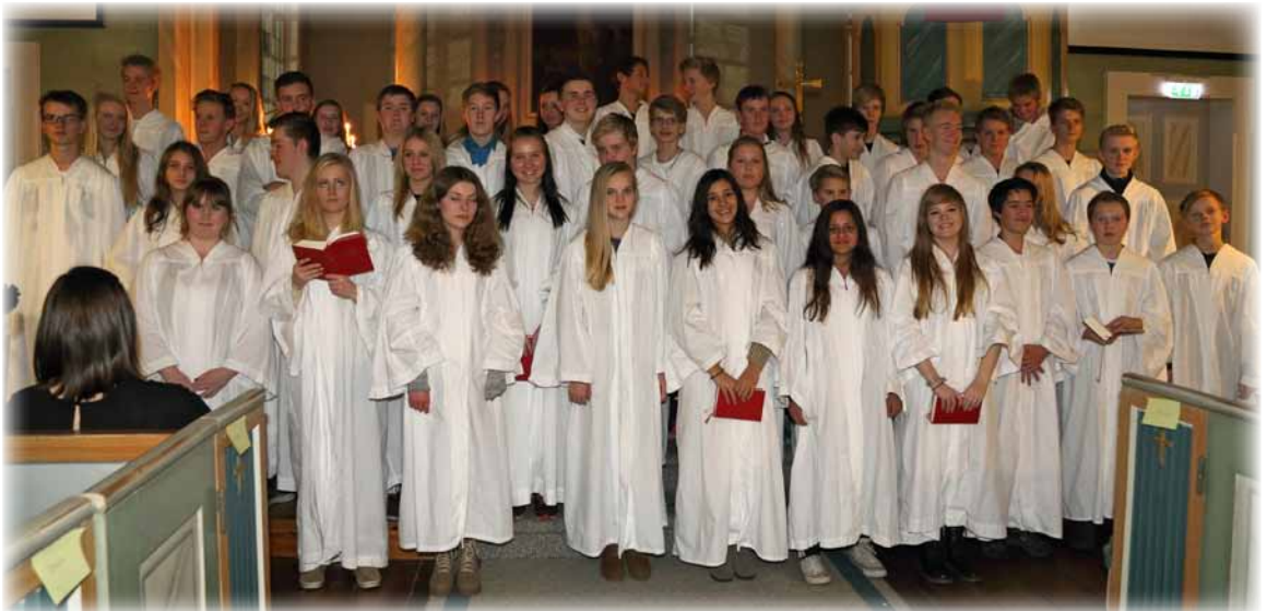
Konfirmantkor - Foto: Torbjørn Hovland

dei opp og prøvde seg som konfirmantkor og song "Opp gledest alle" med melodien til Odd Nordstoga, ikkje heilt lett men svært sporty. Slik enda ei flott helg.