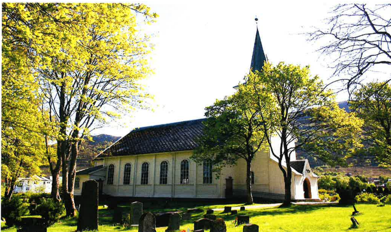
HAREID KYRKJE, kyrkjegarden og Den norske kyrkja sitt arbeid er ein viktig del av tilbodet for innbyggjarane i Hareid kommune.

På vårparten vart kyrkjeromet vaska grundig frå golv til tak, og flekkmala grunna slitasje. Dette vart gjort av eit innleigd selskap. Det er og blitt montert vern over alle omnane i kyrkjeromet.