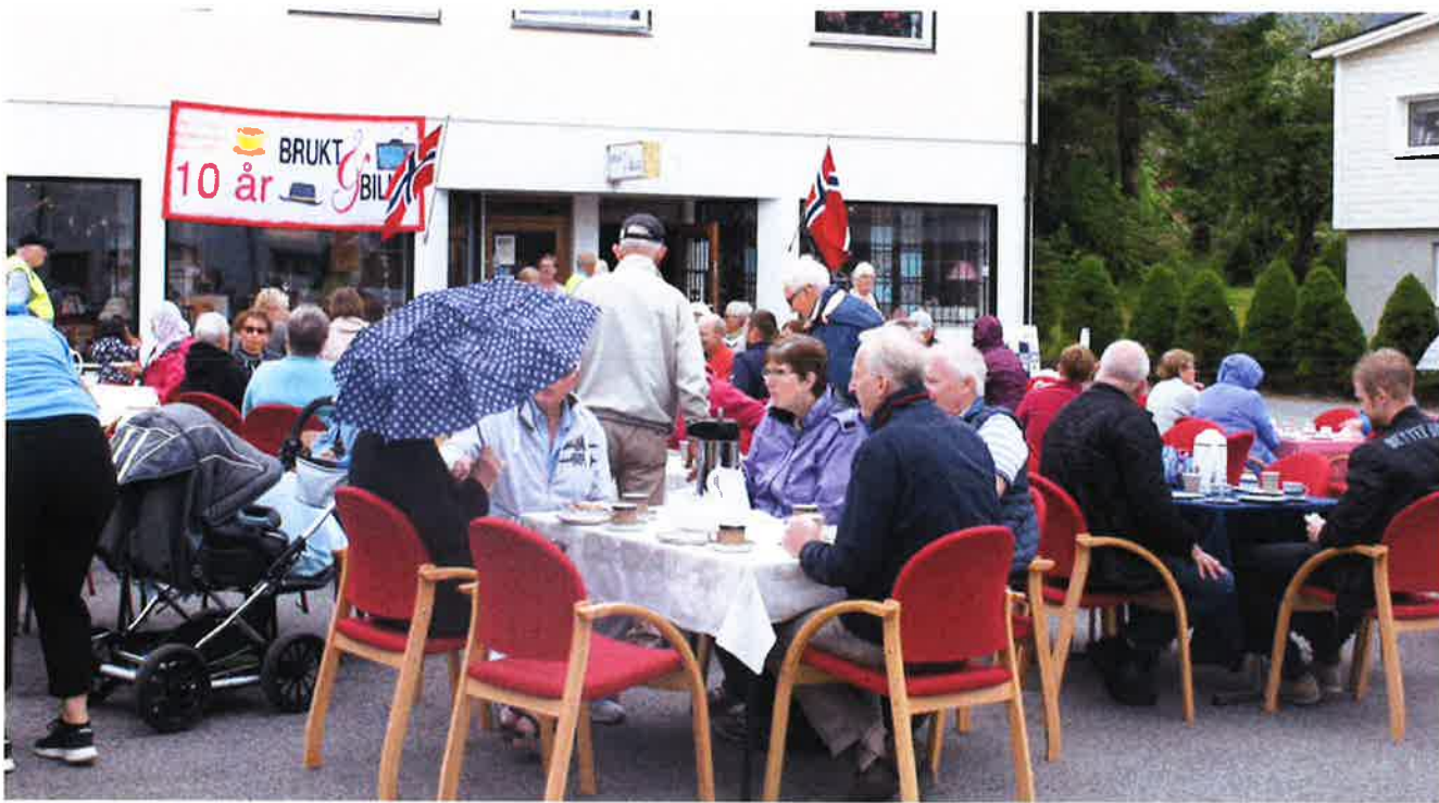
25-ÅRSJUBILEUM: Frivilligsentralen feira sitt 25-årsjubileum med utandørs frukostcafe og markerte samtidig Brukt & Billig sitt 10-årsjubileum. Taler, underhaldning og musikalske innslag bidrog til ei fin markering.

Antall frivillige som gjorde ein innsats i 2017 ligg på om lag 95 personer, noko som til saman blir om lag 7.000 frivillige arbeidstimer. Dette arbeidet står det respekt av og vi er svært takksame for innsatsen som dei frivillige bidreg med for å skape eit godt lokalsamfunn. Vi er og takksame for eit fellesskap prega av likeverd, deltaking og respekt for mangfald!