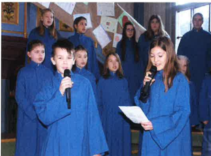
HAREID MINI- OG BARNEKANTORI: Mykje leik og moro, men sjølv sagt også ein del øving for koret som har bidrege med songglede i ei årrekke.

Kultur og musikk har det også vore i Hareid kyrkje, i form av konsertar med variasjon. Vi vonar det har vore noko for einkvar smak. Vi er vesigna med mange lokale og talentfulle innbyggjarar som har bidrege!