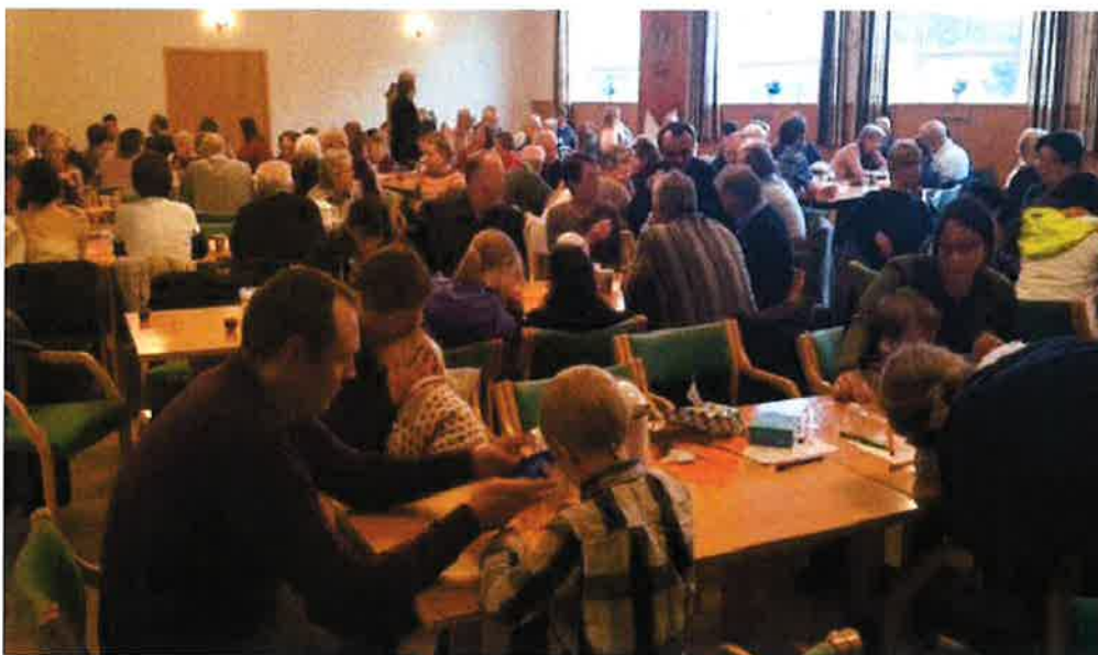
FELLES MØTEPlass: Internasjonal middag/Thanksgiving på Hareid bedehus, eit arrangement der mange ulike kulturar og religionar møttast til ei fin stund saman med god mat og god prat.

Vi la vekt på at dette ikkje var ein kyrkjemiddag, men eit økumenisk arrangement der folk frå fleire kulturar og religionar tok del.