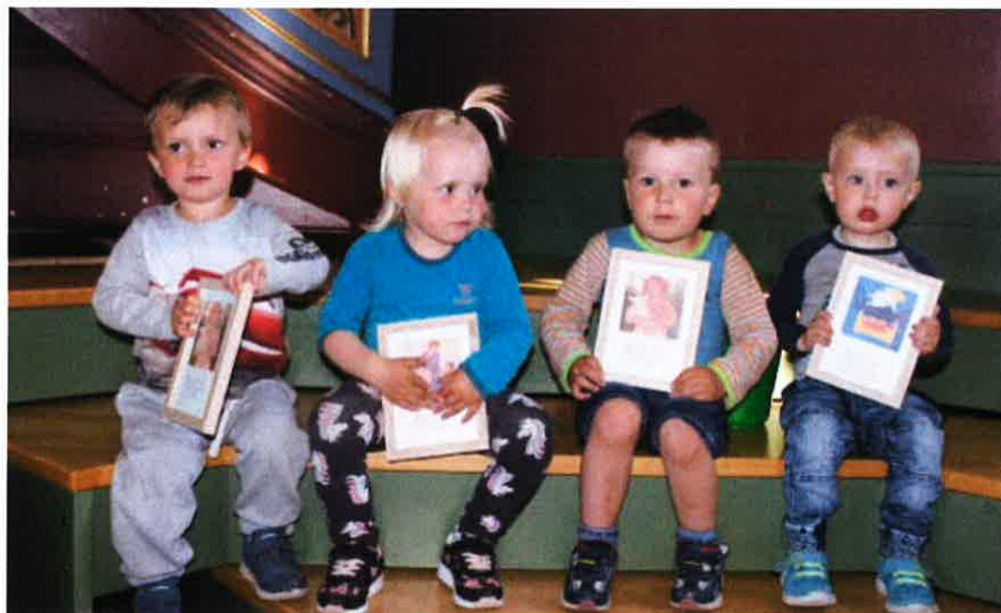
2-åringar på dåpsmarkering får seg bilde med kveldsbøn på