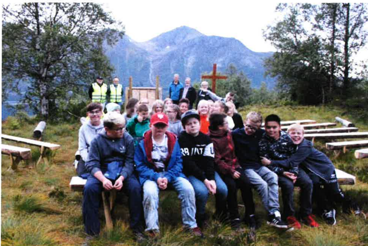
Lionskarane på Alskleiva saman med juniorkonfirmantane inspiserer Alskleiva torsdagen før gudstenesta.

Etter gudstenesta på Alskleiva i 2017 kom nokre i snakk om at det hadde vore kjekt med fleire benkar å site på. Det er heilt greitt å site i lyngen, men på dagar med regn og væte er ikkje det så kjekt. Det brukar som regel å vere mykje folk samla til denne gudstenesta, både 7 og 12 åringane i trusopplæringa har oppgåver i og kring denne gudstenesta. Karane i Lions tok utfordringa og har laga mange nye siteplassar på gudstenesteplassen. Dei har også laga nytt kors og talarstol. Det er mykje godt som kan skje når fleire gode krefter går saman!