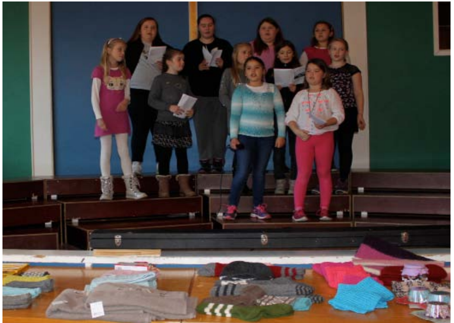
Frå samlinga "Middag og Misjon" der det er åresal til inntekt for misjonsprosjektet.

Hareid kyrkjelyd har avtale med Det Norske Misjonsselskap (NMS) om kyrkjelyden sitt misjonsprosjekt i Thailand. Misjonsutvalet arbeider med å gje informasjon til kyrkjelyden om misjon generelt og om misjonsprosjektet spesielt, og med å samle inn pengar til misjonsprosjektet.