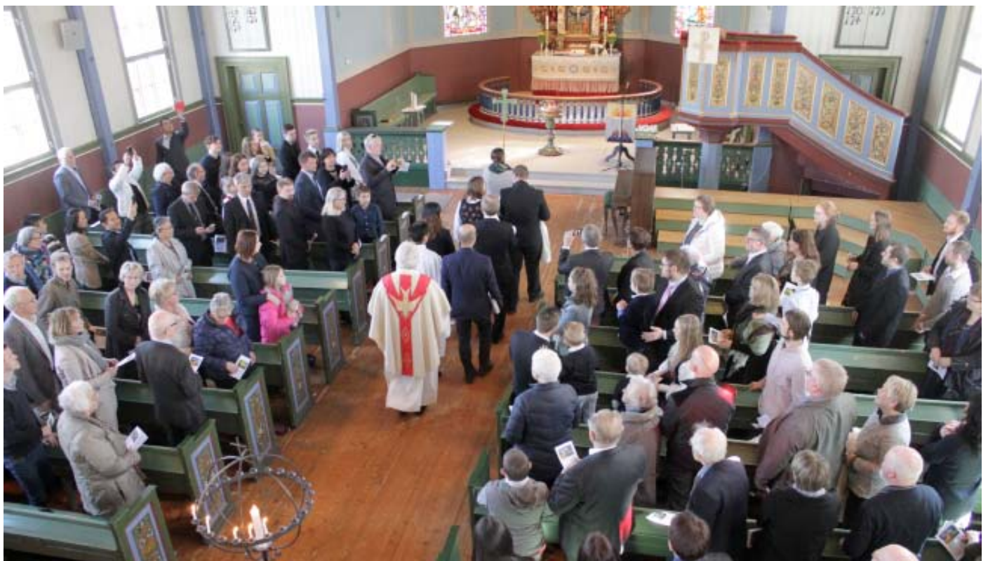
I kyrkja kan vi kome som den vi er, med den trua som kvar enkelt har - og ta i mot av det Gud vil gi oss.