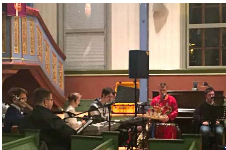
FJØRESTEINANE: Bildet viser litt av den supre gjengen i "Fjøresteinane" Dei har gleda oss med konsert før jul dei to siste åra.