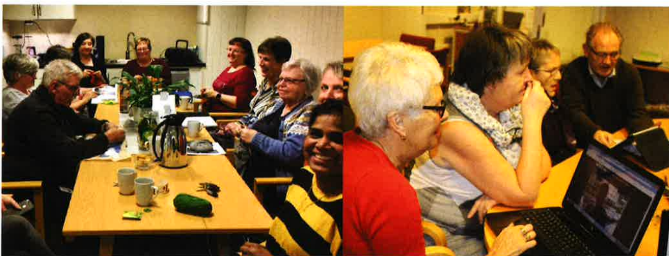
FRIVILLIGSENTRALEN TIL HAREID SOKN: Sentralen har vært i drift siden 1992, og bidrar med mange gode tilbud. Hobbyklubben er ein populær møteplass, og det er rimelig fullt rundt bordene når de samles. Seniornett er et annet treffpunkt, der du kan få hjelp med ditt digitale verktøy.

«Sammen skaper vi gode og inkluderende lokalsamfunn»