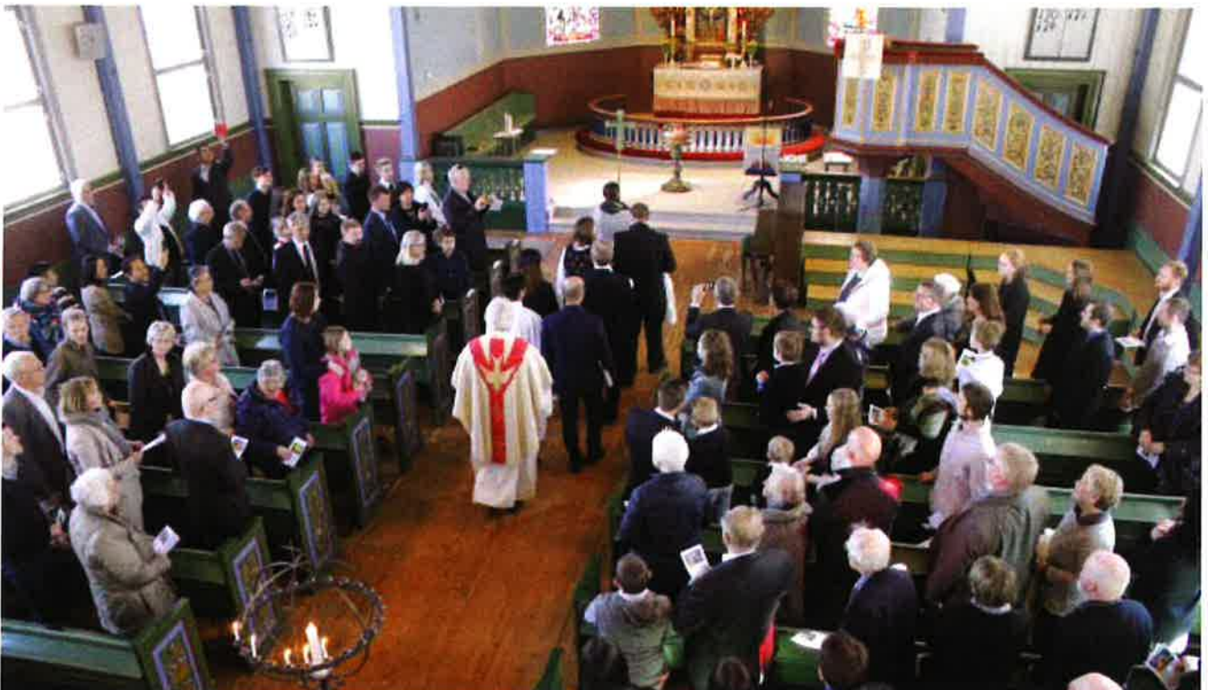
I kyrkja kan vi kome som den vi er, med den trua som kvar enkelt har - og ta i mot av det Gud vil gi oss.