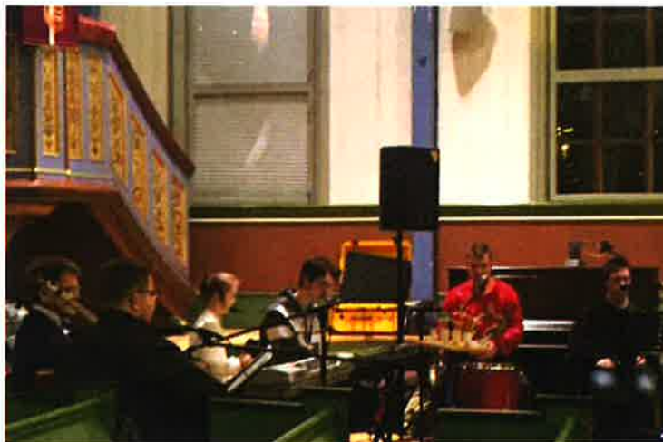
FJØRESTEINANE: Bildet viser litt av den supre gjengen i "Fjøresteinane" Dei har gleda oss med konsert før jul dei to siste åra.