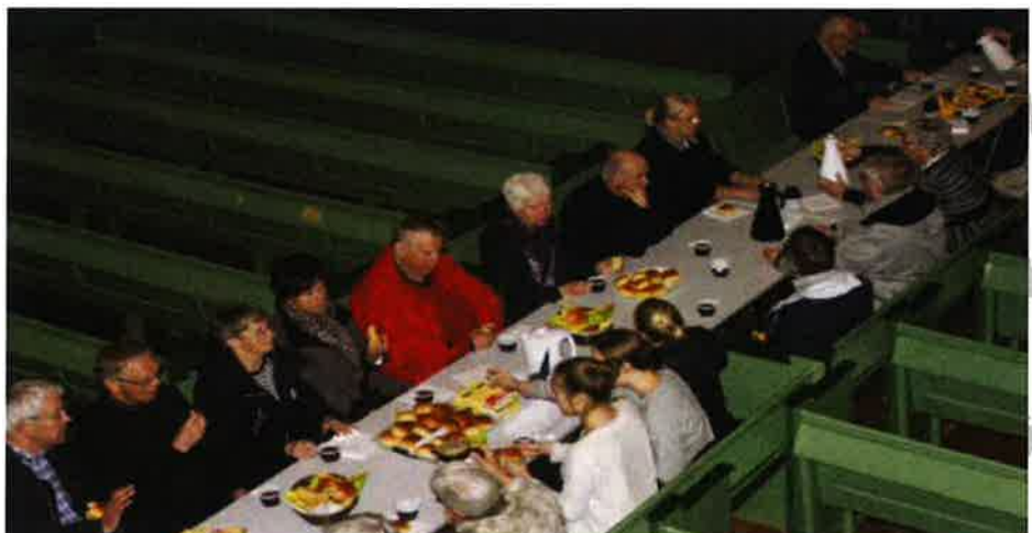
Frå langbordet Skjærtorsdag.