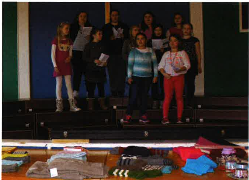
Frå samlinga "Middag og Misjon" der det er åresal til inntekt for misjonsprosjektet.

Hareid kyrkjelyd har avtale med Det Norske Misjonsselskap (NMS) om kyrkjelyden sitt misjonsprosjekt i Thailand. Misjonsutvalet arbeider med å gje informasjon til kyrkjelyden om misjon generelt og om misjonsprosjektet spesielt, og med å samle inn pengar til misjonsprosjektet.