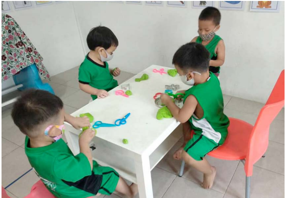
MISJONSPROSJEKTET: Frå prosjektet kyrkjelyden støttar i Thailand. Barn på dagheimen "Lousangshjemmet".

Hareid kyrkjelyd har avtale med Det Norske Misjonsselskap (NMS) om kyrkjelyden sitt misjonsprosjekt i Thailand. Misjonsutvalet arbeider med å gje informasjon til kyrkjelyden om misjon generelt og om misjonsprosjektet spesielt, og med å samle inn pengar til misjonsprosjektet.