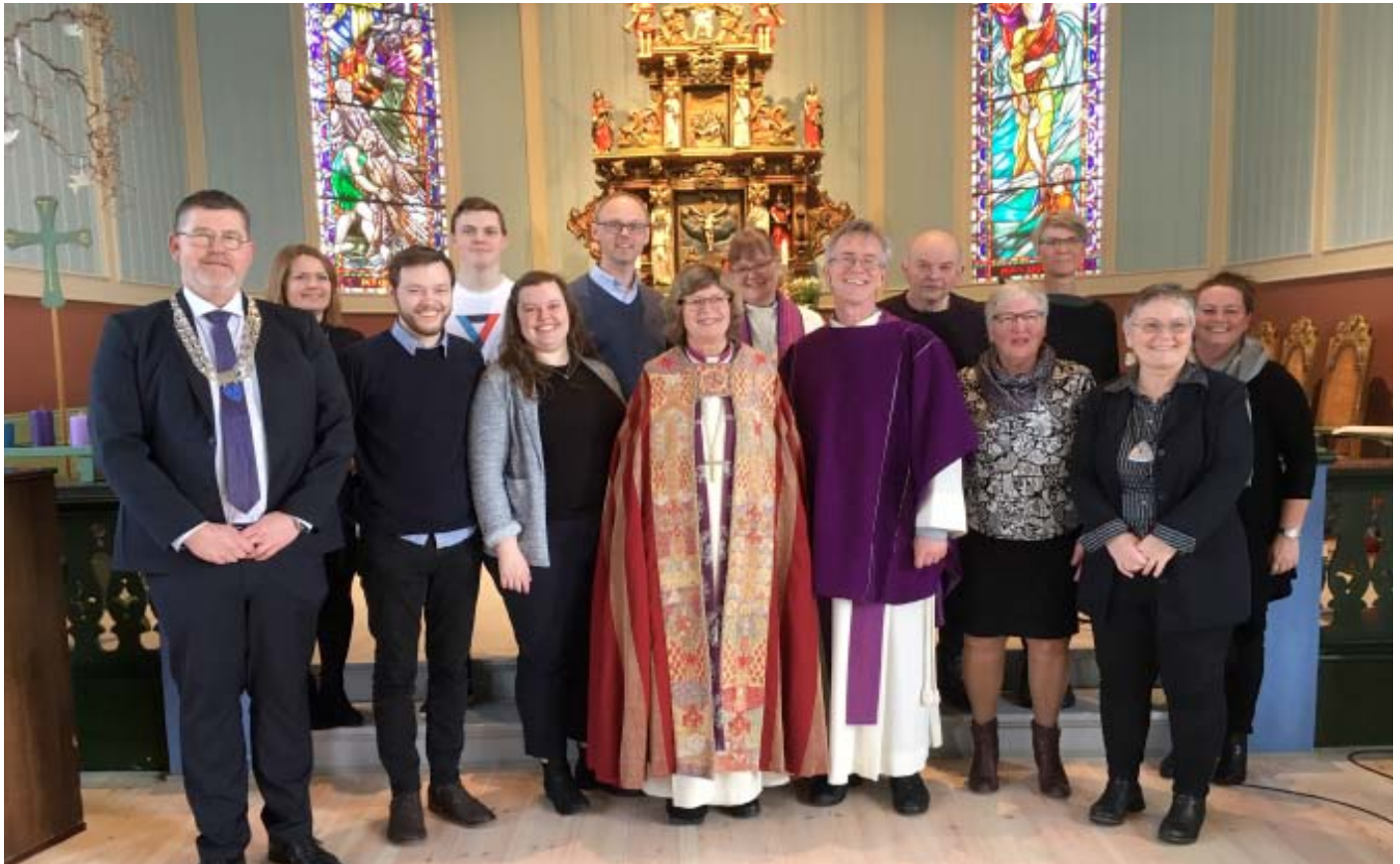
BISPEVISITAS FEBRUAR/MARS 2020: Kyrkja sitt viktige arbeid i lokalsamfunnet, krev samhandling og gode relasjonar både internt i DnK og til frivillige, lag og organisasjonar, politikarar og kommuneadministrasjonen.