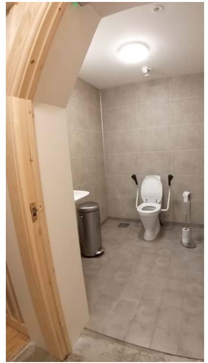
NYTT TOALETT: Endeleg fekk vi nytt toalett i kyrkja, universelt utforma.