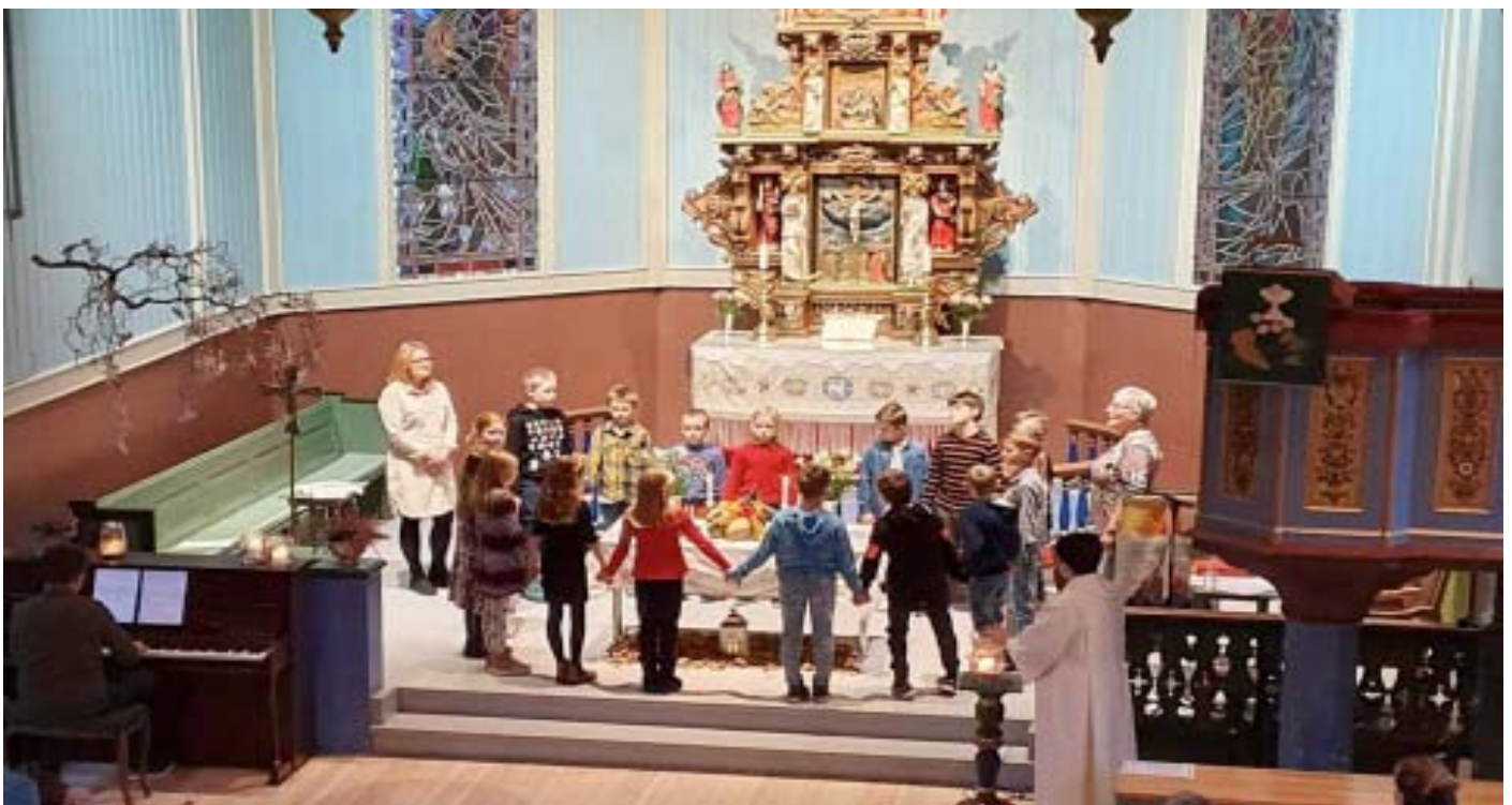
TRUSOPPLÆRINGA: Barna som er med i trusopplæringa deltek også aktivt i gudstenestene.