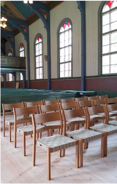
NYE STOLAR: 30 nye stolar framme i kyrkja gir meir fleksibilitet for dei ulike aktivitetane i kyrkja. Same stolar som i Nordstrand kyrkje.