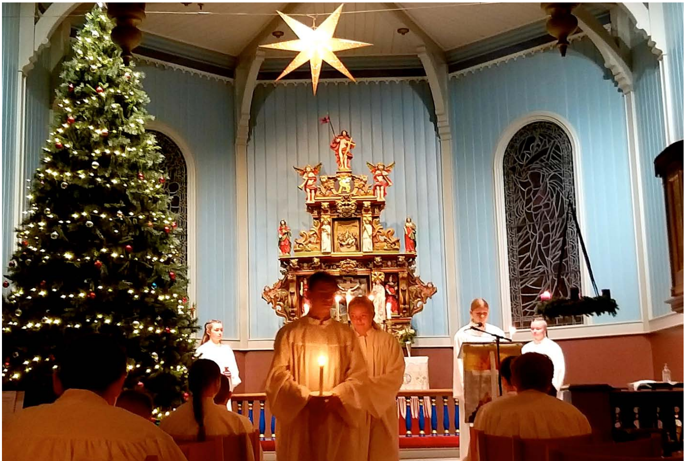
LYSMESSE: Den tradisjonelle lysmessa for konfirmantane blei gjennomført også i år, der vi køyrte 3 lysmesser tilpassa restriksjonane. Ei fin og verdig markering for dei komande konfirmantane.