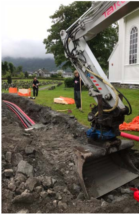
GRAVING: Rørlegging frå redskaps- hus til kyrkja, i høve det nye varme-systemet, samt fiber til kyrkja.