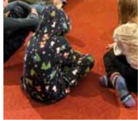
Barn fra Halsa og Valsøyfjord.