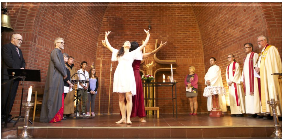
Døvekirkens høymesse med poesi, dans og stor deltakelse av frivillige i Oslo døvekirke

Fra avslutningsgudstjenesten for Døvekirkenes Fellesmøte i Oslo døvekirke 29. mai 2011. I denne gudstjenesten ble også ny døveprost Roar Bredvei innsatt i tjenesten som døveprost.