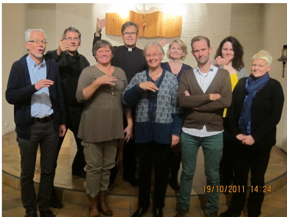
Ansatte og tilreisende på prostebesøk i Bergen Døvekirke. Her fremføres Bergen menighets visjon: "fremtid (bakerste rekke) og håp (fremste rekke)"