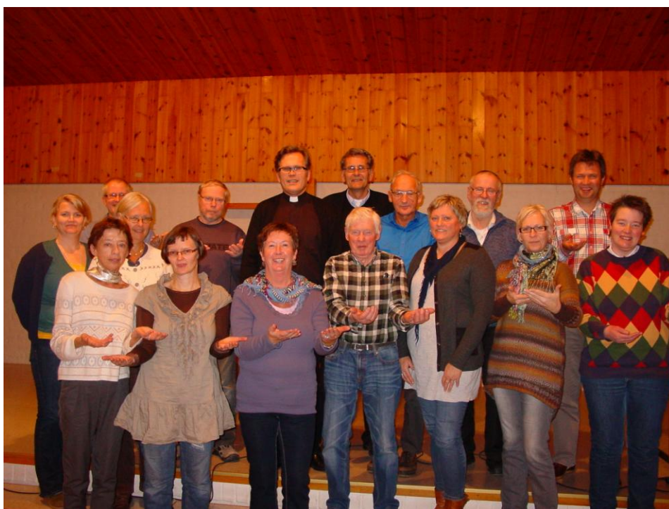
Menighetsrådet i Møre sammen med ansatte og tilreisende på prostebesøk i Volsdalen kirke i 2011.

Møre. Døvemenigheten på Møre har en jevn og god gudstjenestefrekvens. I tillegg har menigheten også samlinger i Ålesund og Molde med preg av diakonalt møtested / Åpen kirke med enkel bønn eller andakt.