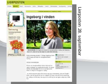
Lierposten 28. september