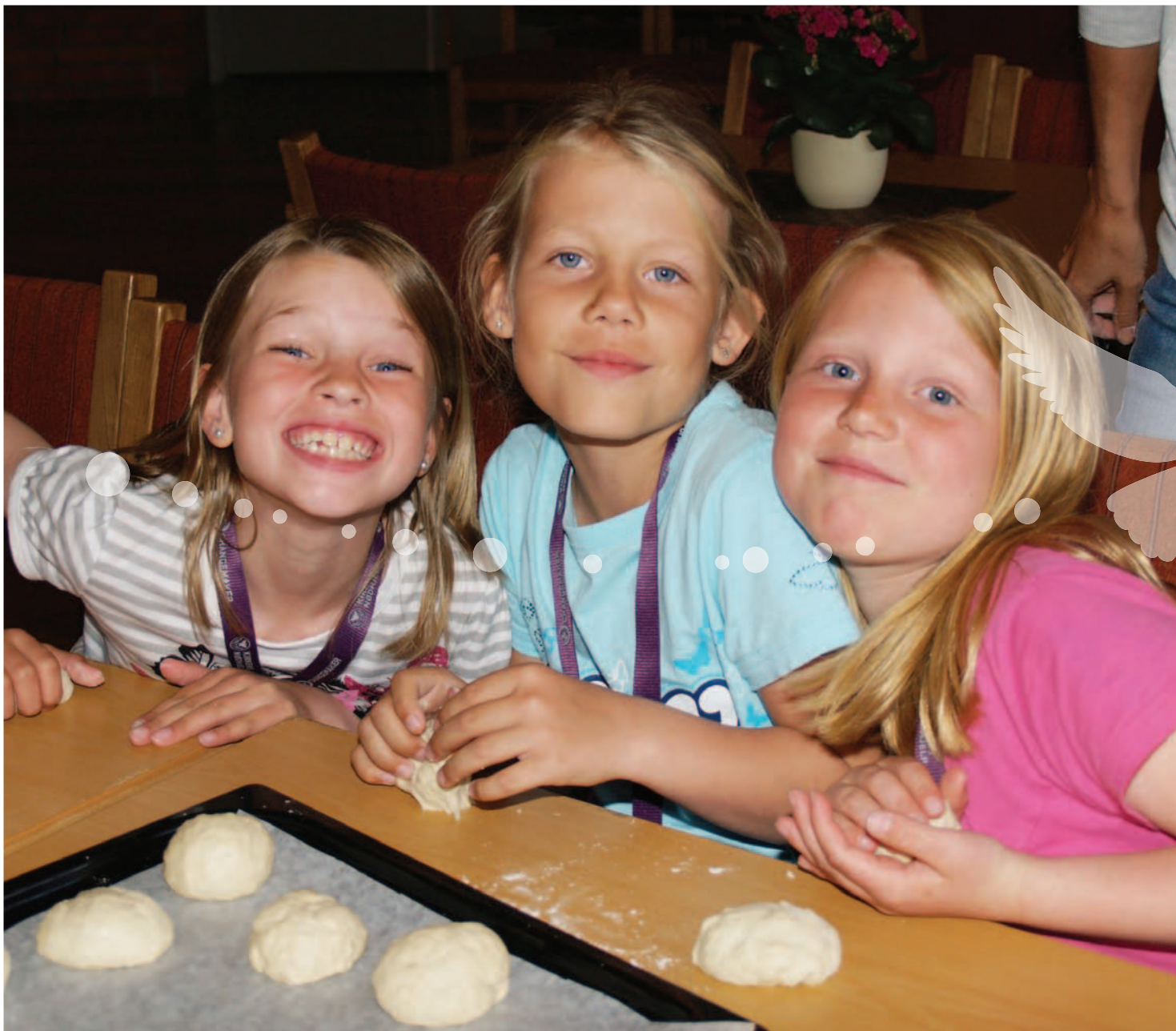
Kyrkjemøtet 2009 vedtok Plan for trusoplplæring med tittelen «Gud gir vi deler». Trusoplplæringa gir rom for mange aktivitetar, som til dømes bollebaking i ein sørlandskyrkjelyd.