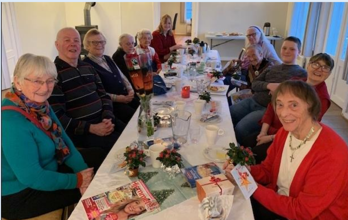
Høstseimesteret ble avsluttet med grøttest på Villa Solhaug, utlodning og mange julesanger.