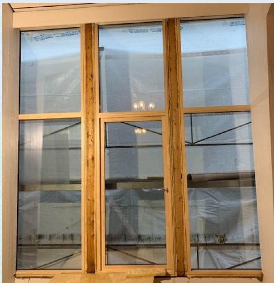
Nye vinduer i menighetssalen!

Nå gjenstår gang oppe med heis, ny garderobe og HC toalett, oppgradering av kjøkken og menighetssalen, kirkerom og utearealer. Vi håper pengene strekker til slik at kjøkkenet vil bli funksjonelt med nye maskiner, at skyvedør i menighetssalen blir reparert, at kirkerommet får nytt gulv og at kirkebenker blir byttet ut med stoler.