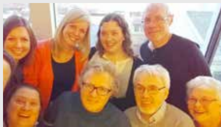
Selfie. Nåværende MR.

I neste nummer kan du bli kjent med de som stiller til valg for fire nye år i Manglerud menighetsråd.