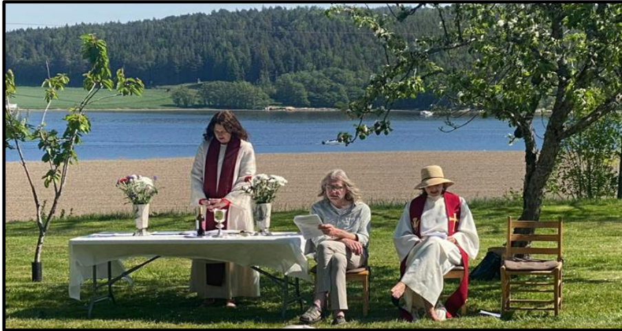
Arenaene er mange. Her fra fellesgudstjeneste i friluft sammen med Gamle Fredrikstad menighet ved Heie gård