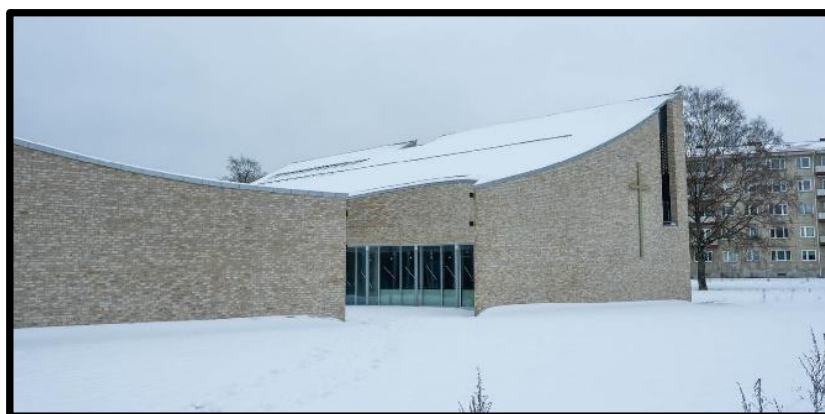
Kirken i Mustamäe