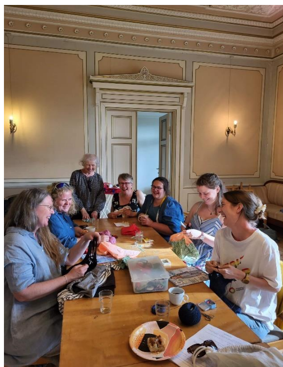
Foto: Fra babysang i Kampen menighetshus, og Omsømkveld i Konfirmantsalen Vålerenga prestegård.