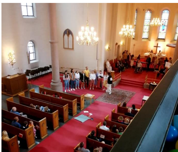
Hvordan ville det se ut om vi fikk flammer på hodet?!