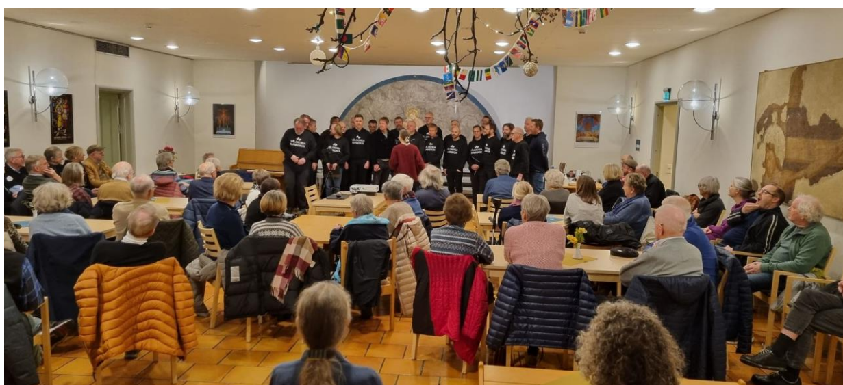
Vålerenga mannskor synger på møte med Vålerenga historielag, 15.11.22.

Vålerenga historielag er fast leietaker i kirka, med to kontor i 3. etasje, og møter og utstilling i salen nede, som alle er godt besøkt. Utstillingshelga sammenfaller i tid med kirkas vigselssdato (10. okt). Siden det i år var 120 år siden kirka ble vigslat, var et av utstillingstemaene kirkas historie og kunst. Reiner Schaufler hadde bl a hentet opp fra prestegårdskjelleren noen deler fra kirkens alterparti før brannen.