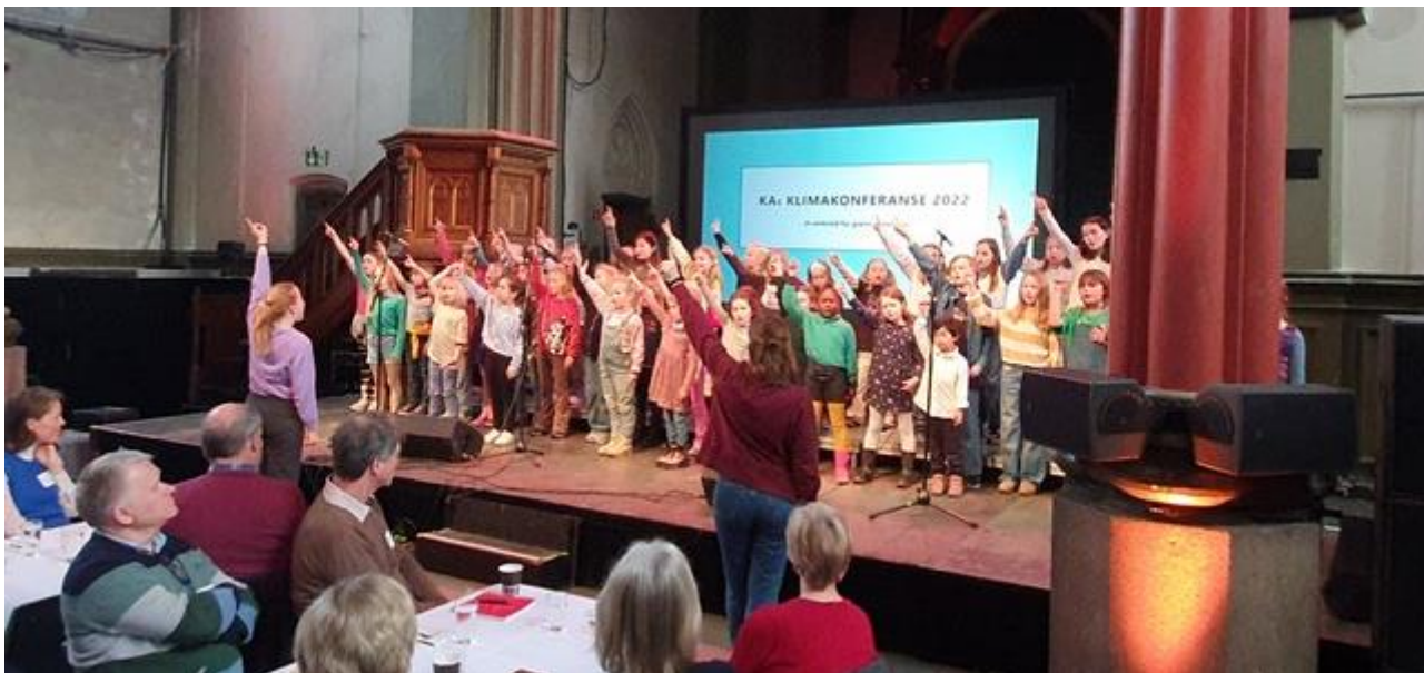
Vålerenga barnegospel på sangoppdrag på Klimakonferansen til KA – Kirkens Arbeidsgiverorganisasjon.