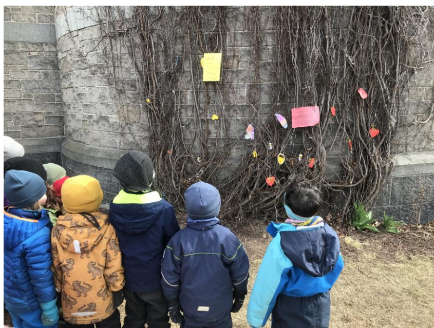
Foto: Noen barnehager hadde med påskepynt som de hang opp på «Villvinveggen» ut mot parken.

I tillegg får vi stadig spørsmål fra studenter i praksis, som gjerne skal ha med en barnegruppe til hellige rom, for å observere hvordan det er. I februar år kom noen da fra Kværnerbyen barnehage med en liten flokk veldig interessert førskolegruppe, som også kom igjen til påske, og vi kunne fortsette samtalen med dem der.