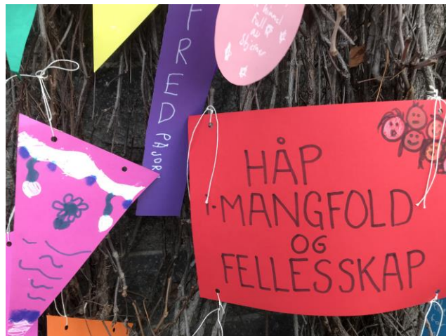
Fra fastelavnsfeiring i parken etter gudstjenesten 13. februar: Villvinveggen får nye uttrykk