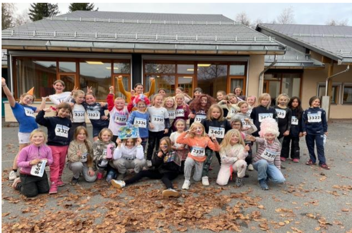
35 barn fra Vålerenga var med på barnefestivalen i Lommedalen kirke med KFUK-KFUM Oslo/Viken.