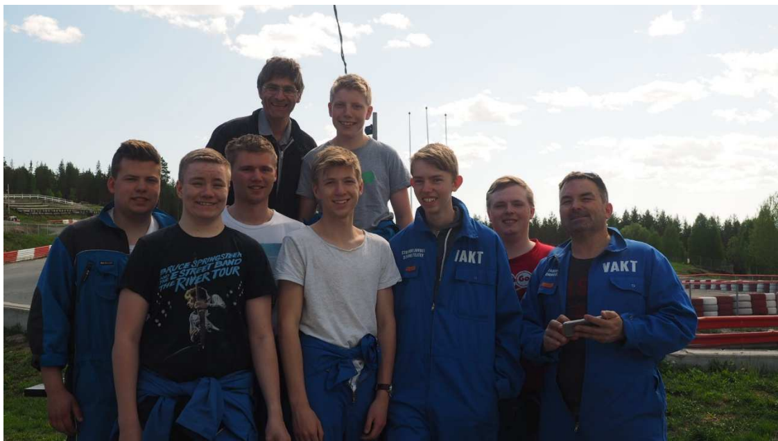
KRIK-gjengen på GoCart i Sigdal.