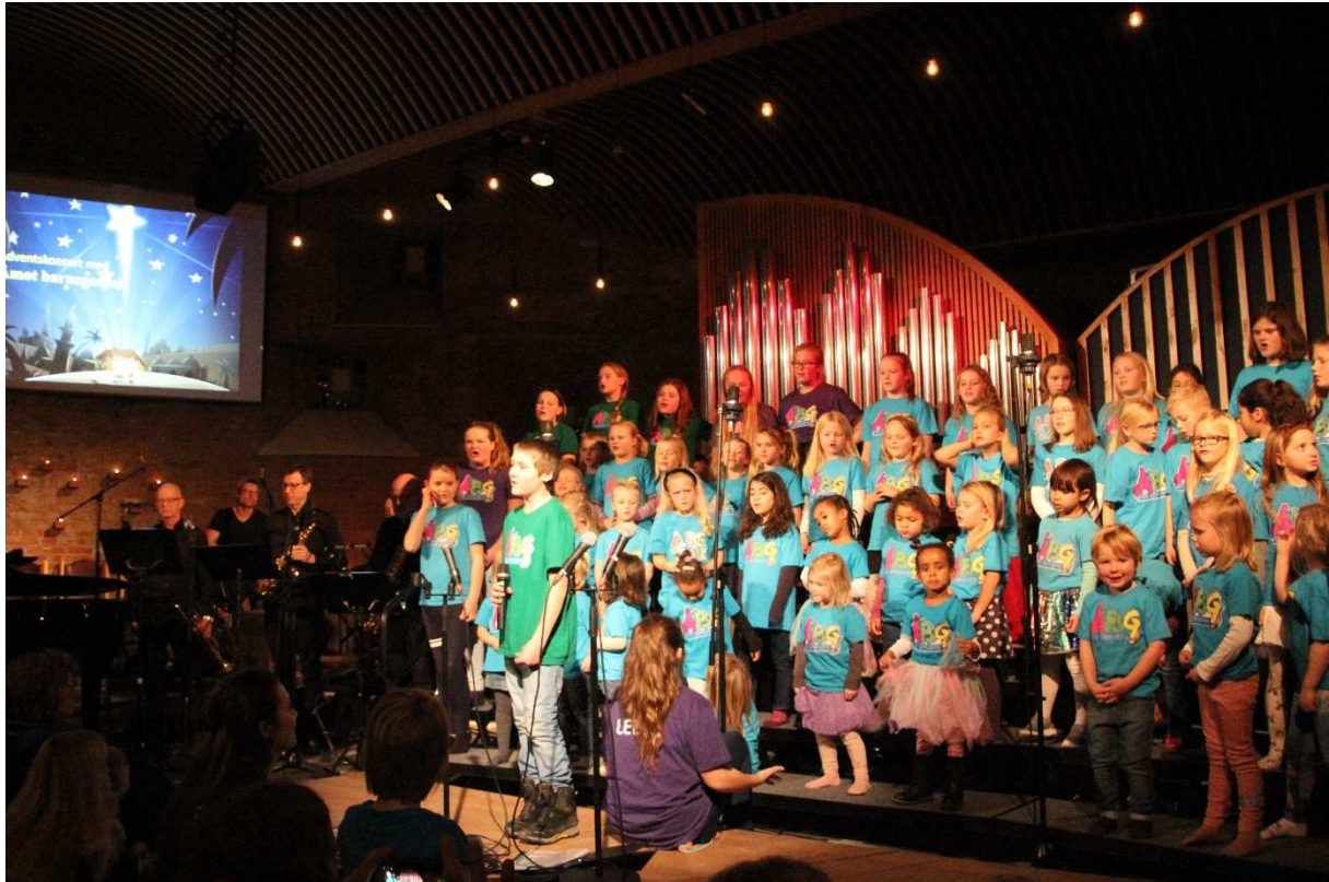
Adventskonsert i Åmot kirke med band og sangere!

Foreldre/foresatte er med som ”tilskuere” og dugnadsfolk under øvelsene/kveldsmaten. I gudstjenestene deltar barna aktivt gjennom kor, solister, dans, band og deltagelse i ulike ledd i liturgien som prosesjon, forbønn, nådehilsen og kollekt. Barnegospelen har fortsatt et godt lederteam med veldefinerte oppgaver. Lederteamet ønsker at barn skal bli kjent med Jesus, glad i sang, musikk og dans og kjenne seg hjemme i menigheten og kirkelivet.