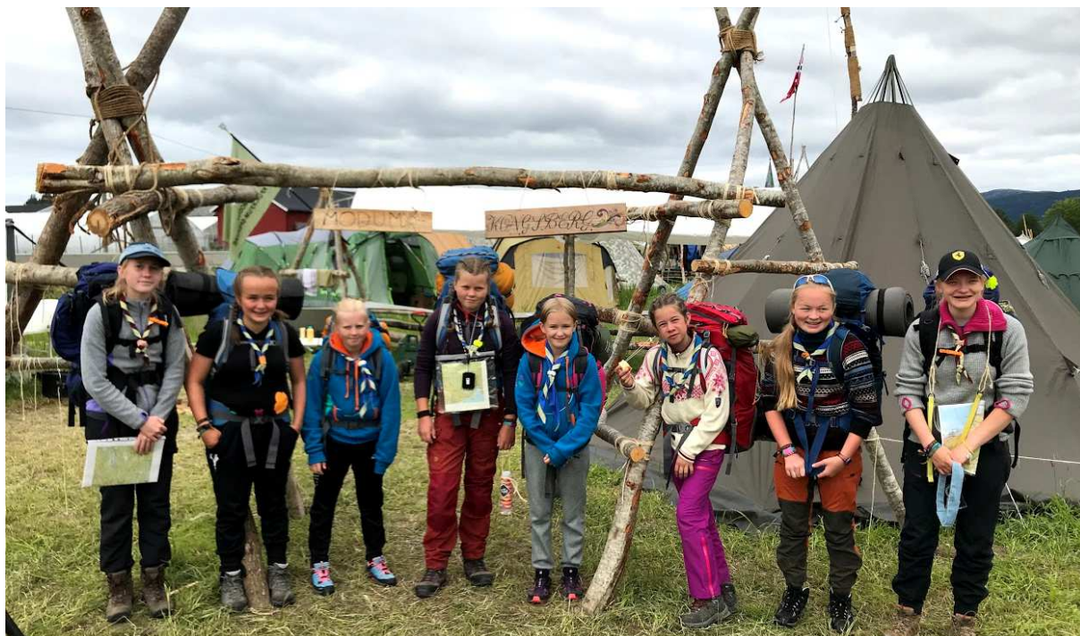
Patrulje med Modum og Kongsberg speidere klare for haik!

I 2018 var vi for første gang i nyere tid med på KFUK-KFUM-Speidernes Landsleir. Dette ga mange flotte opplevelser for store og små sammen med 4500 andre speidere fra hele landet og flere andre nasjoner.