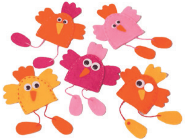
Kylling av filt.

Det beste med kirken min, hva er det? Det er nesten vanskelig å velge! Den er så fint bygget, den ligger midt på øya vår, den har veldig fin utsikt, den har et fantastisk glassmaleri, den har til og med sin egen lekeplass. Men det aller beste er nok alle dere flotte mennesker som «lager» kirken vår hver dag! Når dere kommer hit og er med på alle tingene som skjer, da er dere med på å skape et miljø og en stemning som er skikkelig bra! Da skaper dere et fellesskap! Og det er nettopp det fellesskapet her som er veldig verdifullt for meg, og det aller beste med kirken min! Jeg liker så godt å høre til et sted der folk er opptatt av å tenke på og snakke om hva som gir et godt liv, hva det er å tro på Gud, og hva som skaper vekst og glede for andre. Kom og bli med, du også, da vel! ♥