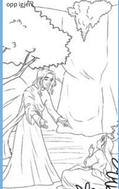
Tegning: Chiara Bertelli

FARGELEGG bildet av Jesus som viser seg for Maria etter at han døde og stod opp igjen.