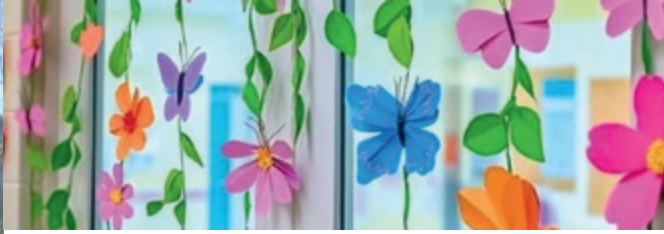
Blomsterranker av papir.

Har du lyst til å finne på noe gøy eller koselig utenom alt du kan være med på i kirken?