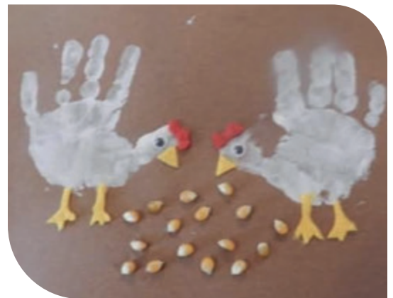
Høner av håndmaling.