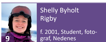
Shelly Byholt Rigby