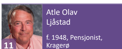
Atle Olav Ljåstad