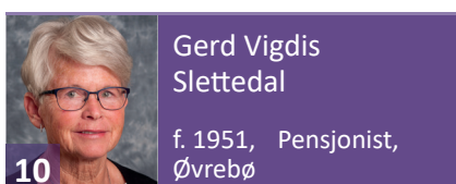
Gerd Vigdis Slettedal