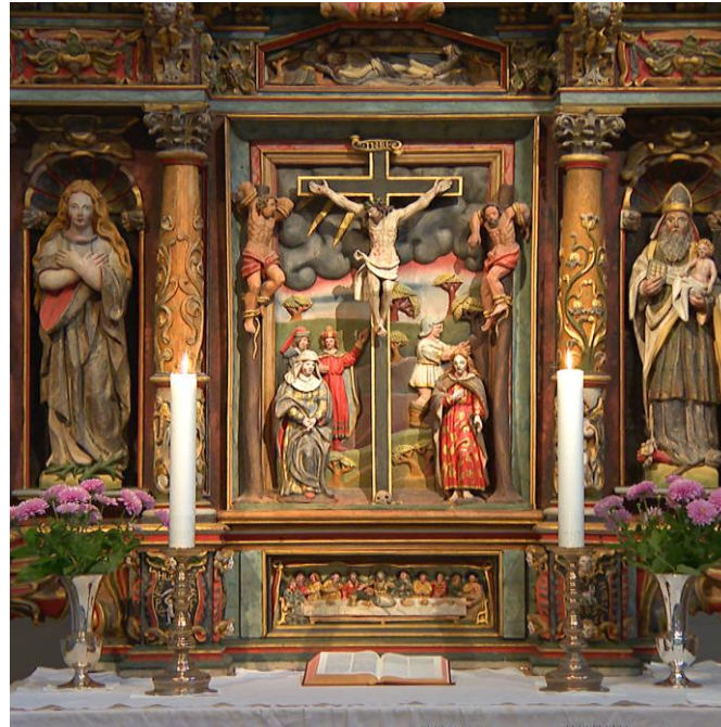
Altertavle, Førde kyrkje