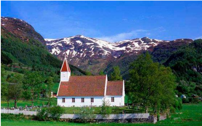
Ålhus kyrkje, Jølster