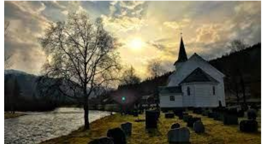
Sande kyrkje, Gaular