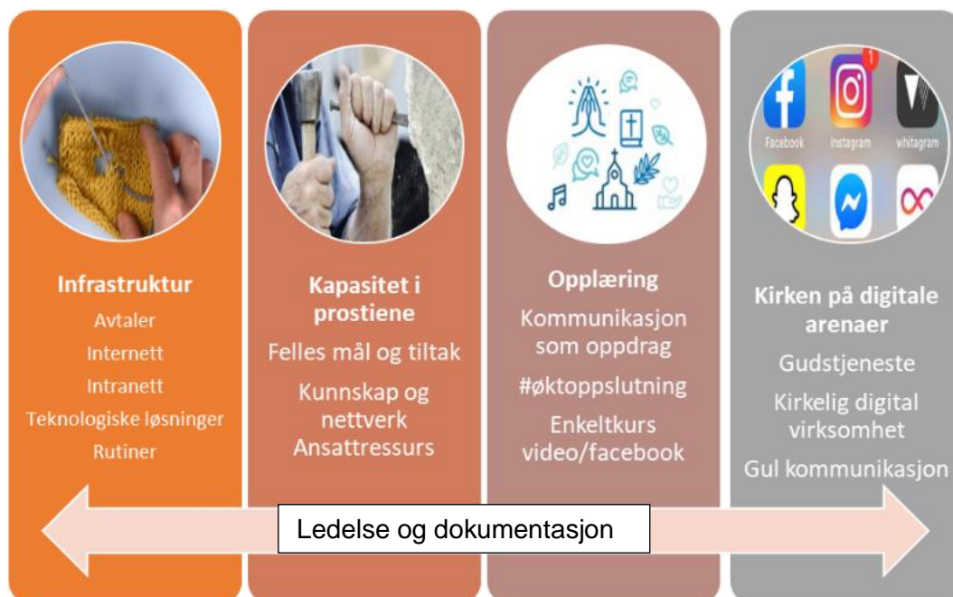
figur 1. Oversikt delprosjekter

Da korona-nedstengningen var et faktum bidro det etablerte nettverket til en rask omstilling til digital kirke, både ved strømming og gjennom sosiale medier. Andre fase av Kommunikasjonsløftet besto i høy grad av tilrettelegging og støtte for menighetenes arbeid på digitale plattformer under koronapandemien fram til fra mars 2020 til mars 2022.