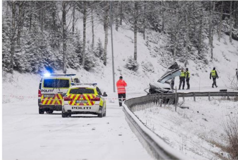
DØDSULYKKE: En person er bekreftet omkommet i en frontkollisjon på riksvei 4.