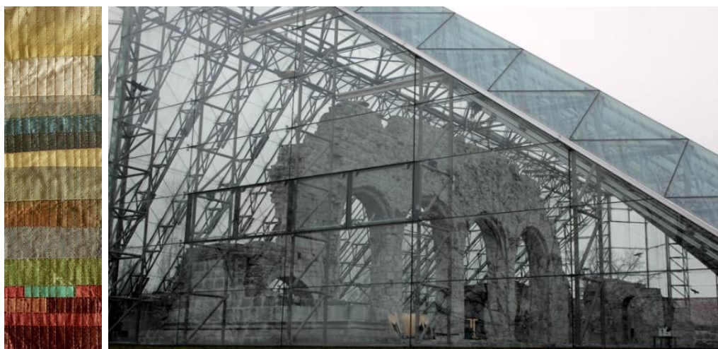
Hamardomen. Glassoverbygget sto ferdig i 1998.

Ornamentikken og fargene på silkestolpene, brystspennen og skjoldet er inspirert av det varierte kulturlandskapet som Hamar bispedømme ligger i. I forslagene er det benyttet en form for lappeteknikk i silke. Første forslag er i et fargespekter fra den dypeste skogbunn, gjennom gylne duvende åker, de blå innsjøene og grønne tretopper, til himmelens blåtoner. Det er sydd en prøve der sømmen av gulltråder «binder landskapet sammen», som tar opp rutenettet som ligger som en beskyttelse om Domkirkeruinene.