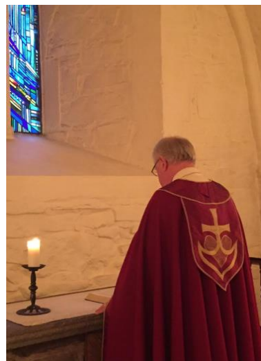
Foto av tidligere produserte reisekåper med utgangspunkt i samme konstruksjon som er tilpasset bruk av ulike skulderbredder og overvidder på brukeren.