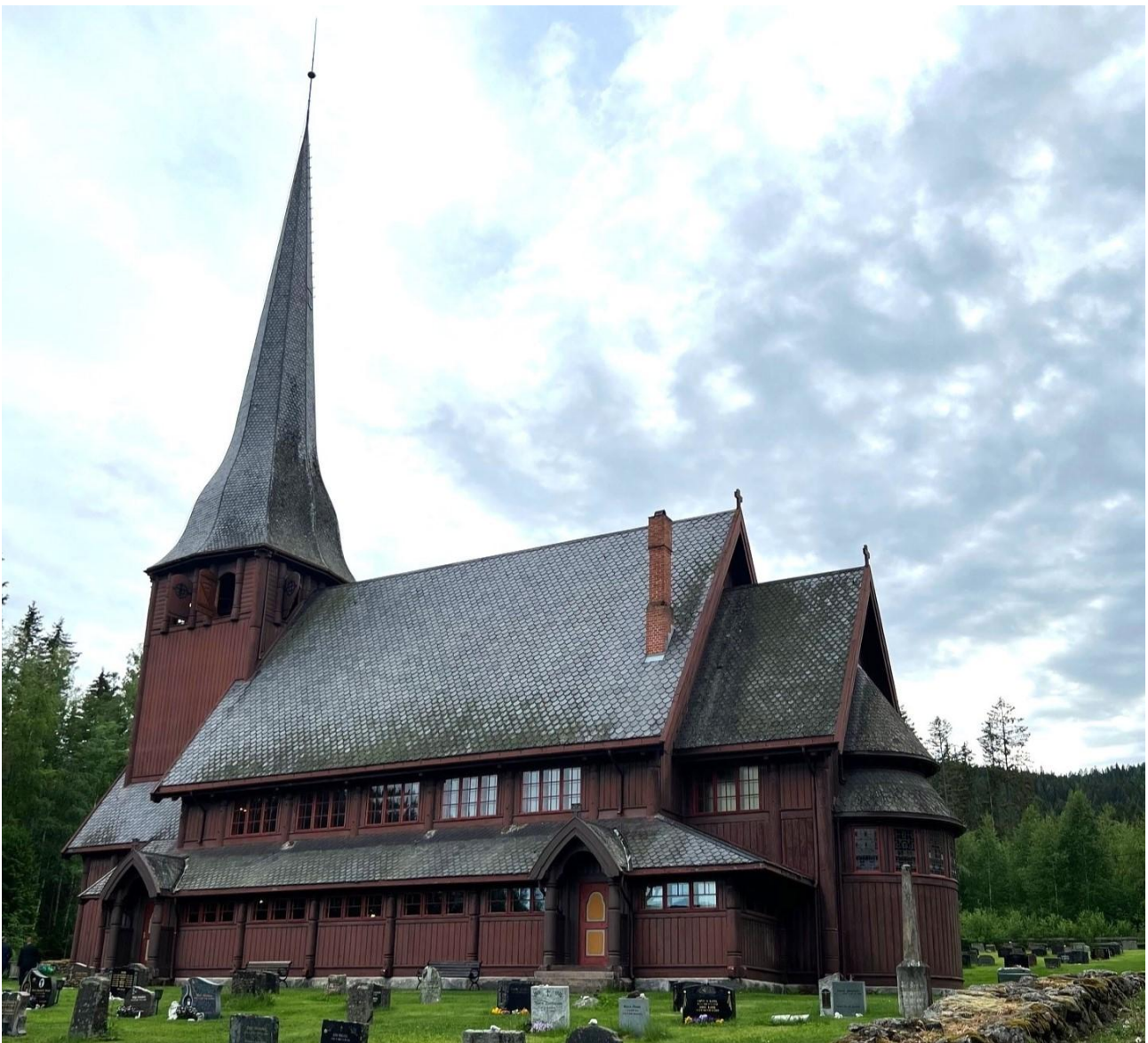
Skute kirke fra 1915.

Kort beskrivelse av kommunen og dens demografiske særdrag, og av kirkelig fellesråds ressurser (inkludert ansatte), virksomhet og utfordringer Prioritert langtidsplan for Kirkelig fellesråd (m.a. investeringer, vedlikehold, stillinger) Siste års regnskap og budsjett for inneværende år