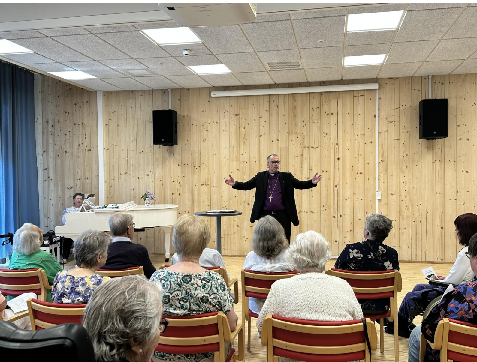
Andakt og salmesang på Hovlitunet første visitasdag i Søndre Land.