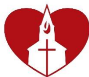
4. Filip Hovland