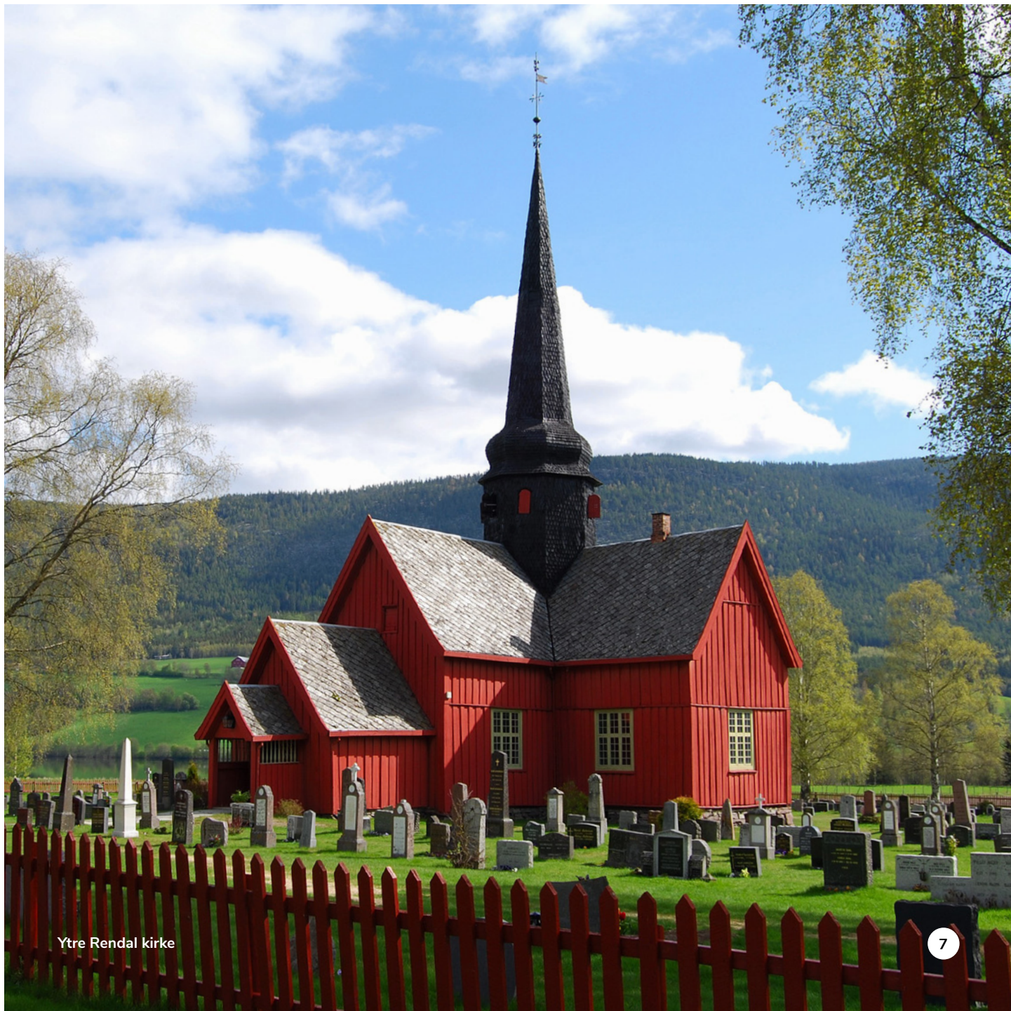
Ytre Rendal kirke