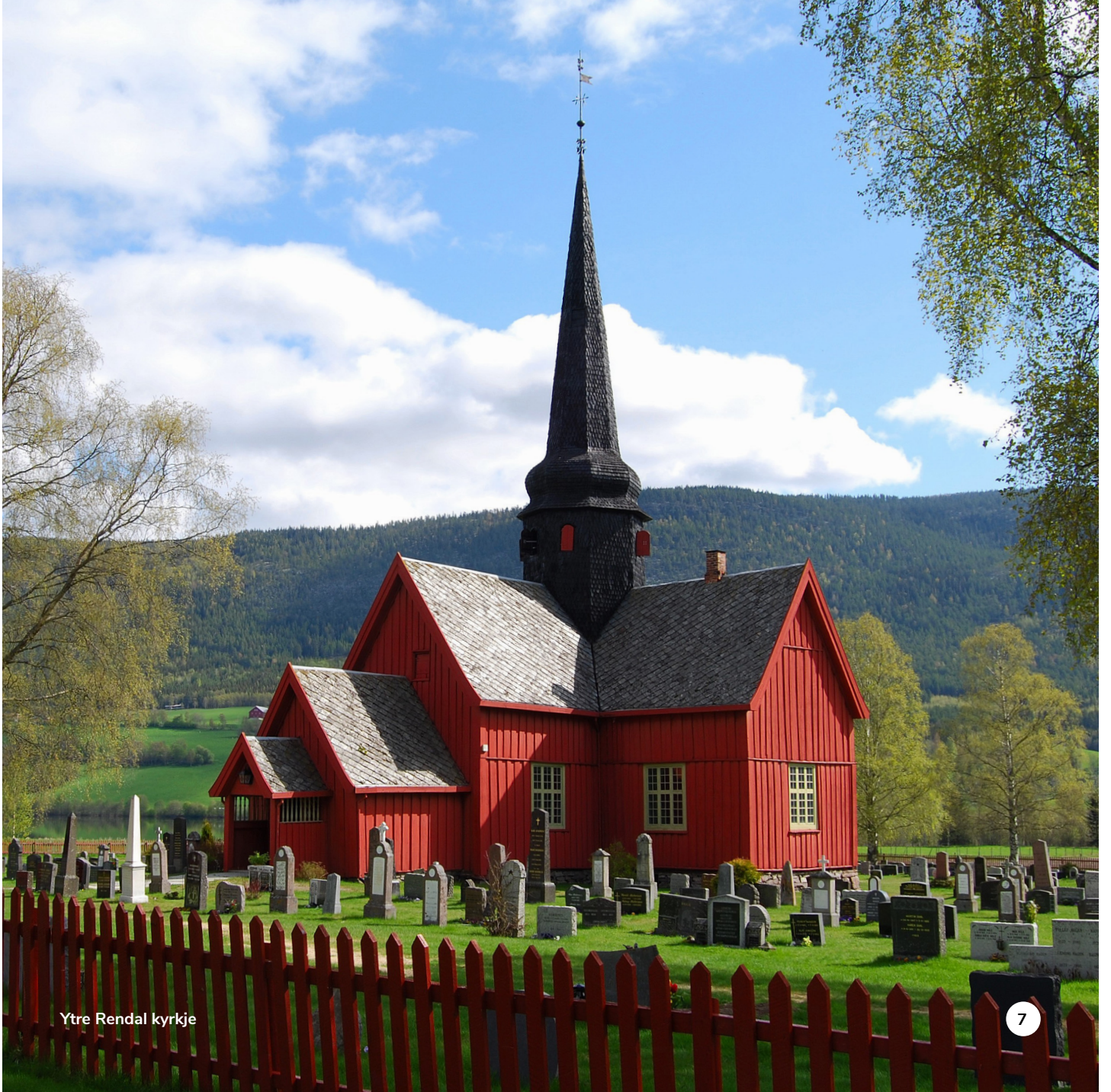
Ytre Rendal kyrkje