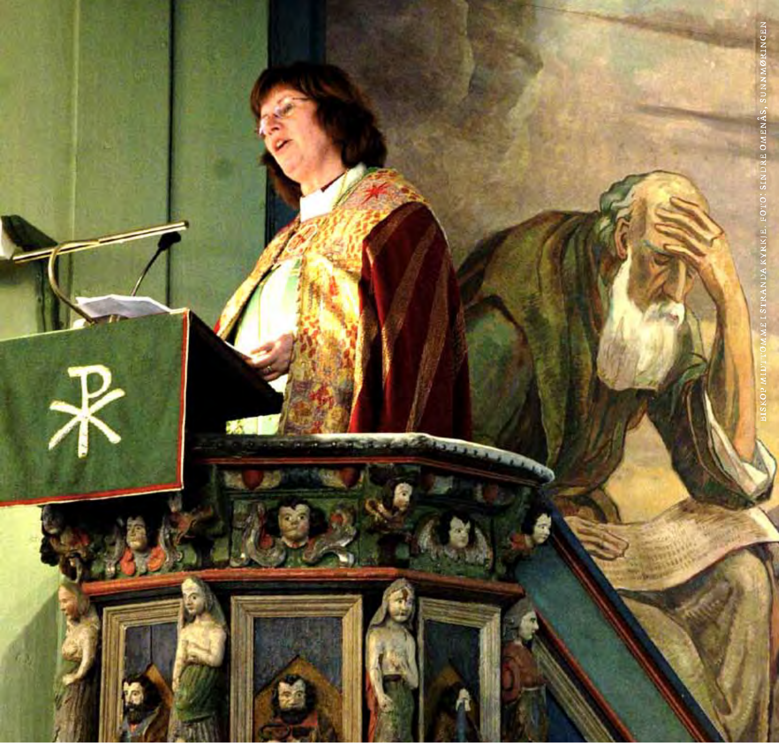
BISKOP MIDT TOMME I STRANDA KYRKE.