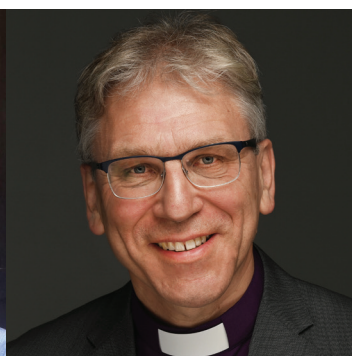
Olav Fykse Tveit