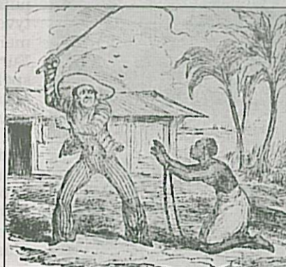
JAMAICA: George Cruikshanks tegning fra 1831 av en kvinnelig slave som blir straffet av plantasjeieren.

■ Tallet på slaver som ble hentet fra vestkysten av Afrika er usikkert, sannsynligvis ble 10–15 millioner tatt i bruk som arbeidskraft på plantasjene.