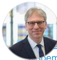
Olav Fykse Tveit Preses i Bispemøtet