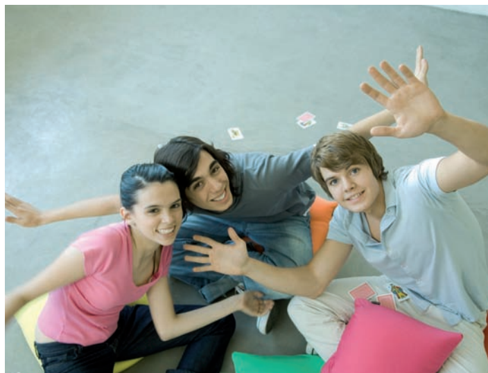
For unge menneske er vennskap spesielt viktig.

Fellesskapa vi byggjer, kan styrkje familiane og vere stader der vi etablerer nye vennskap og tek med venner. Born, unge, vaksne og eldre kan trenge sine eigne fellesskap. Samtidig må ein leggje til rette for fellesskap på tvers av generasjonane.