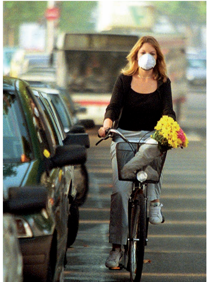
Miljøspørsmåla utfordrar det diakonale arbeidet i kyrkja.

Menneskelivet og menneskeverdet skal vernast frå livet byrjar og til det endar. Kyrkja må derfor vere ei kritisk røyst i høve til dagens abortpraksis, kjempe mot soteringsamfunnet og aktiv dødshjelp, og engasjere seg i dei store etiske problemstillingane som bioteknologien reiser. I tillegg møter diakonien dei konkrete utfordringane frå desse områda på det mellommenneskelege planet. Det finst organisasjonar som arbeider spesielt med dette. Lokalkyrkjelyden kan arbeide med desse emna gjennom etisk refleksjon, sjelesorg og praktiske omsorgsoppgåver, til dømes ordningar med barnevakt og støttekontakt.