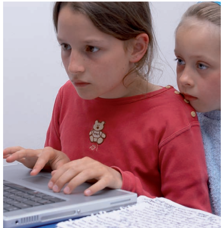
Mobbing av born og unge skjer òg via Internett.

Å kjempe mot vald inneber òg å arbeide med haldningar. Det må drivast førebyggjande arbeid, blant anna ved aktivt å fremje alkoholfrie soner. Her kan det liggje til rette for lokalt samarbeid med politi, skule, uteseksjon, barnevern og familievern, bymisjon og andre organisasjonar.