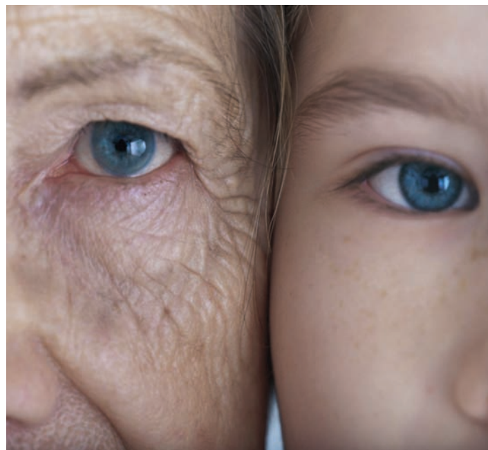
I eit inkluderande fellesskap skal den enkelte både sjå og bli sett.

Kampen for rettferd inneber å stille seg ved sida av medmennesket, ikkje som passiv tilskodar, men i aktivt engasjement. Mennesket lever i og er avhengig av strukturane i samfunnet. Verdsfemnande system er med og styrer livet vårt. Derfor er det nødvendig å klargjere årsakene til menneskeleg naud og lidning, arbeide for å endre det som gjer at ein ikkje får slutt på naudsituasjonen, og skape nytt livsgrunnlag. Å vise solidaritet er å ta opp kampen og arbeide for rettferd og fred.