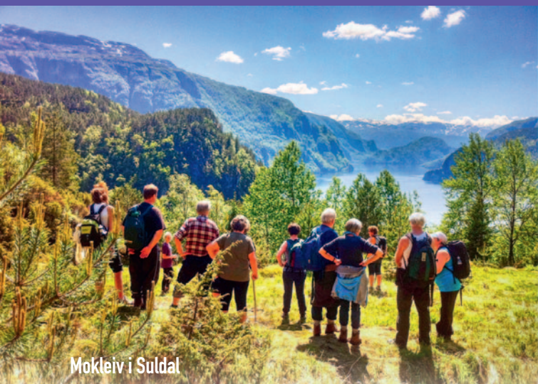
Mogleiv i Suldal