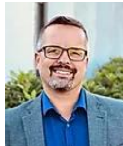
Noen av bidragsyterne.