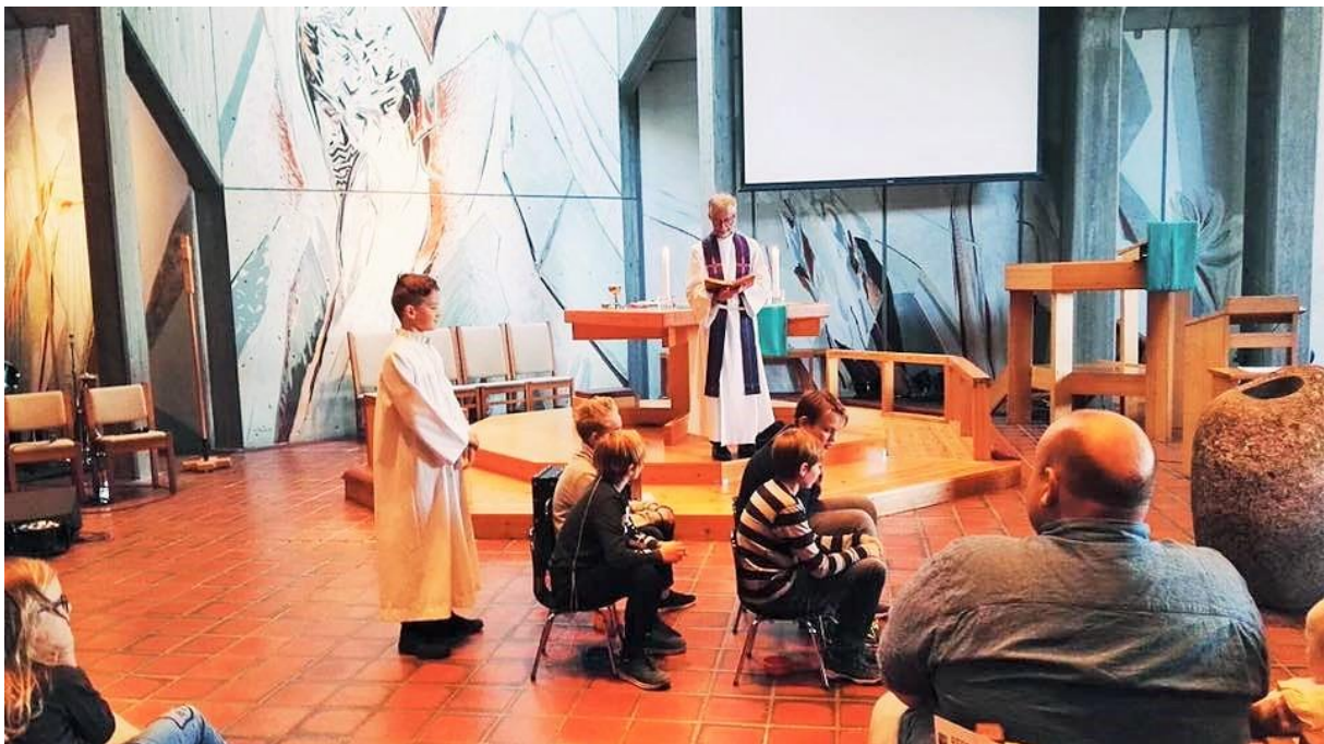
Gudsteneste i Sunde kirke med drama, utdeling av fireårsbok, babysang og misjonstivoli.

Kyrkjeleg nærvær i lokalsamfunnet, fokus på relasjonar, kvalitetsarbeid og frimod på gudstenesta sine vegne kan skapa vekst.