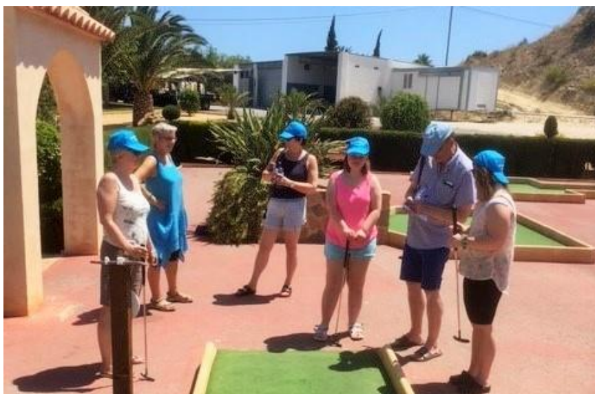
Solgården-turen er ei ferieveke i kyrkjeleg regi for menneske med utviklingshemming. Satsinga gjev «langtidseffekt» og hjelper å nå målet om å inkludera fleire.

Vidare er det viktig å arbeida med korleis me kan rekruttera og inkludera yngre deltakarar og byggja ut dei lokale nettverka. Me vil også hjelpa fleire kyrkjelydar til ei meir aktiv og målretta forplikting på å vera inkluderande. I året som kjem vil me vidareutvikla og styrkja fellestiltak, sjå på verktøyet «vår inkluderende menighet» i prostisamlingar, følga opp tilsette og frivillige leiarar og halda fram dei ressursane og gåvene menneske med utviklingshemning ber med seg.