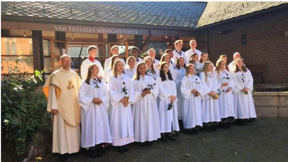
Konfirmantar i Vår Frelsers menighet.

Som ein del av satsinga skal alle kyrkjelydane utvikle lokal plan for konfirmasjonstida i samsvar med Plan for trusopplæring. Det er om lag 20 år sidan kyrkjelydane sist sendte inn plan for konfirmanttida til vurdering hjå biskopen. Målet med planen er å sikre utvikling og fornying i konfirmantarbeidet. Planen skal sendast inn til biskopen innan 15.mars 2018.