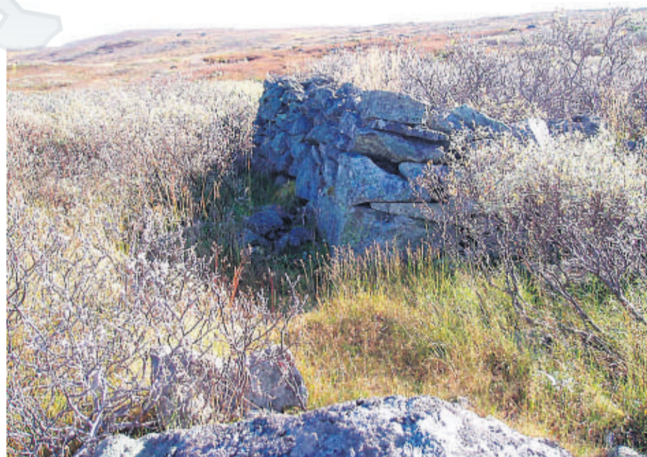
NÆRMER SEG HALLINGDAL: Ruinen av Lakaset viser Usteberget i bakgrunnen.

var hallingens fjell, og dermed kan ha gitt navn til både fjellet og boden, skyldes at hallingene trolig var de første som trengte inn på dette området av Hardangervidda. Det er de topografiske forhold som taler mest for dette. Veivalget på vestsiden var uten tvil det vanskeligste. Det er få steder en kan gå opp på vidda fra vest.