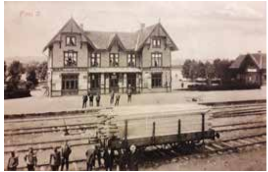
Man har lastet opp en vogn med skurlast, som antageligvis kommer fra Flisen Dampsag & Høvleri. De som har vært med på jobben har stilt seg ved vognen, og der er sannsynligvis eieren av saga også, kommet for å inspisere. På perrongen står stasjonsmesteren og andre jernbaneansatte.

Bildene har vi fått låne av Ole Peter Bentsrud som også har skrevet teksten.