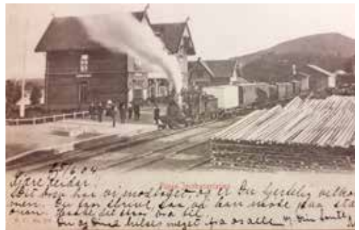
Tog til Kongsvinger klart for avgang, men først skal fotografen ha sitt. Vi ser at lokføreren står inne på loket, og fyrbøteren ute. På perrongen står det 4 jernbaneansatte, konduktøren og tre ansatte på Flisen st. En av dem er stasjonsmesteren. 4 reisende skal med toget. Toget er et blandet tog, og av denne loktypen eksisterer 2 stk, den ene er i operativ drift som Jernbanemuseets karèttoget.