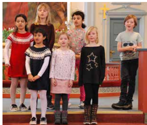
Kirkebok til 6-åringer og barnekoret i Gjesåsen kirke.