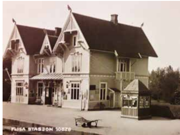
Stasjonsbygningen og den første Narvesenkiosken på stedet.