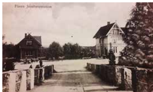
Ett av de få bilder som er tatt fra brua og mot stasjonen. De to som jobber utenfor bryggerhuset har med en rallarbår, mens to andre har tatt 5 minutter ved stabesteinene.