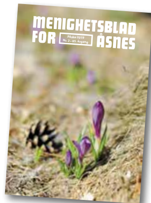
Krokus