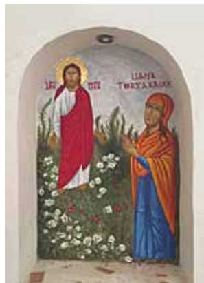
Fra Retreat - og opplærings-senteret Anafora i Egypt, som biskopene i Den norske kirke besøkte i januar i år.