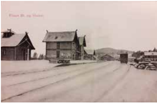
Oversiktsbilde av Flisa st. Det første huset vi ser er prieten (utedoen), så har vi stasjonsbygningen, bryggerhuset, ilgodshus og pakkhuset. Helt til høyre ser vi Flisen Meieri.

fredet. Den brukes nå som vaskehall og overnattings-plass for busser.