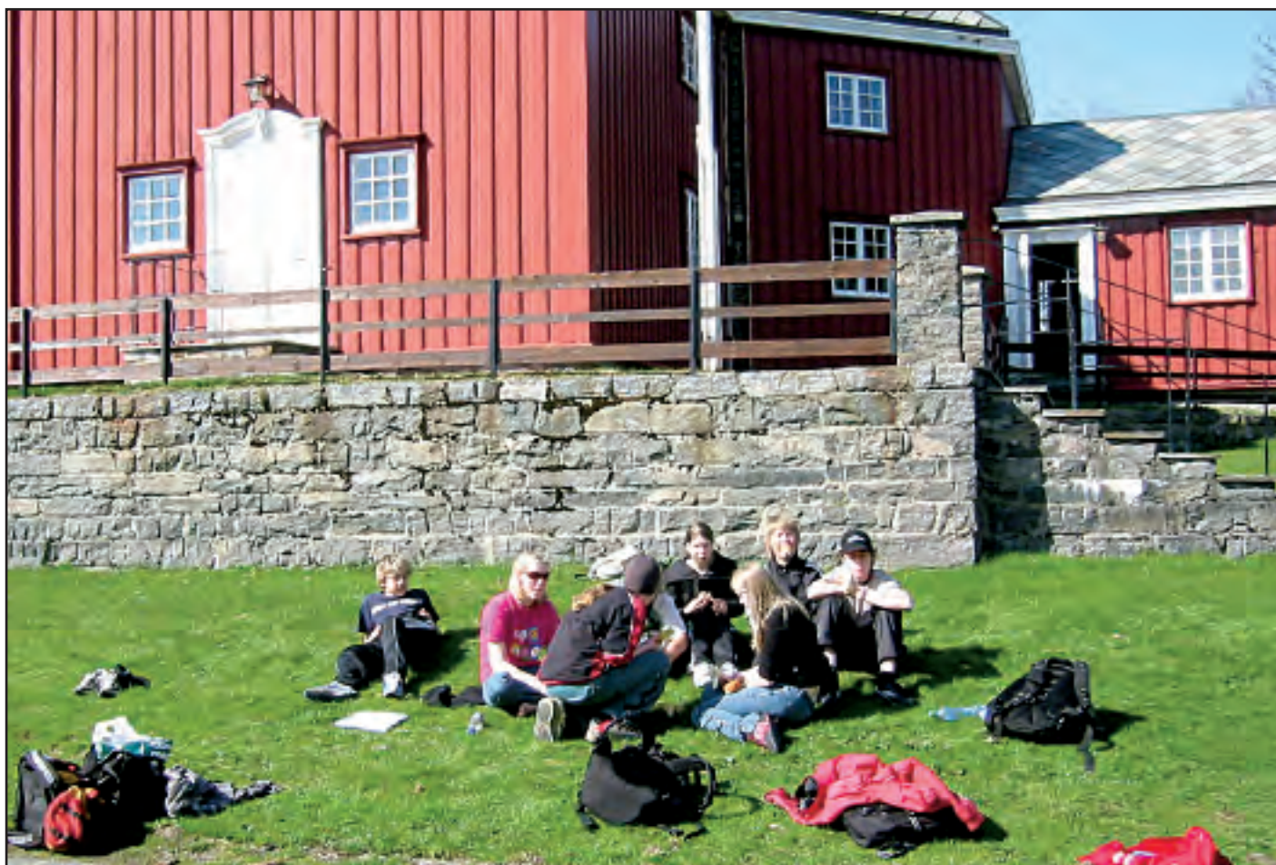
Konfirmantene utenfor Stoksund kirke. 28. april 2005.