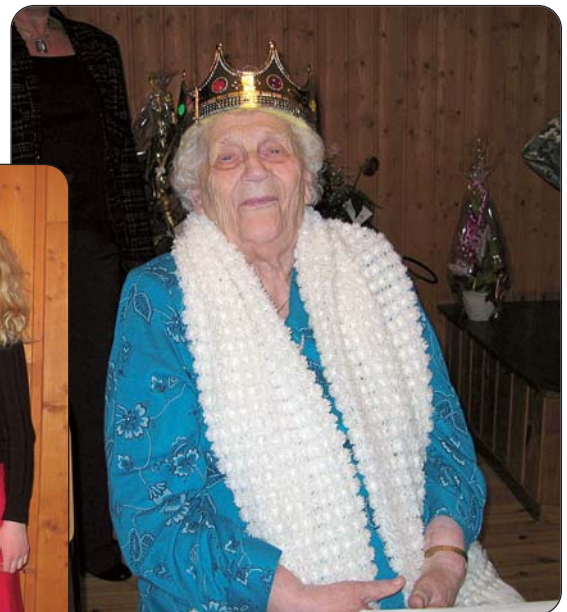
Dronning for en dag.