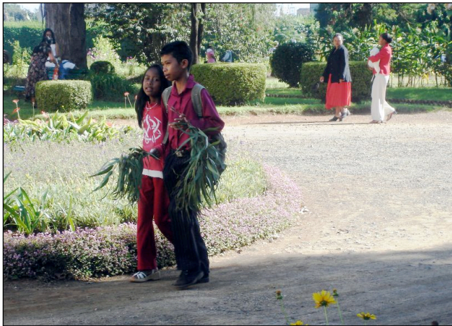
Det er Palmesøndag i Antsirabè. Både barn og voksne kom pynta og med palmegreiner i hendene for å feire gudstjeneste.