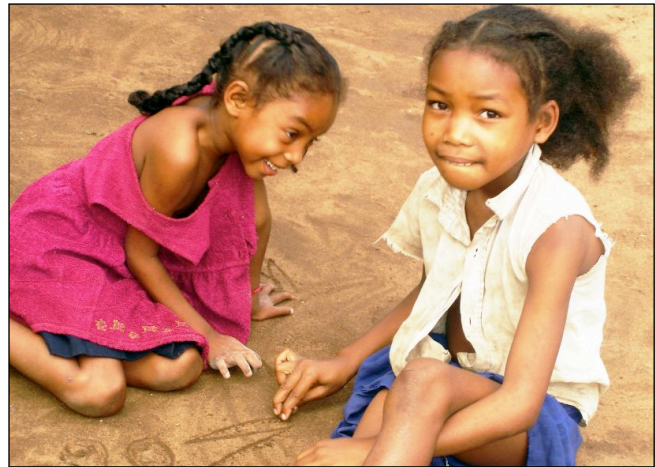
Glade barn koser seg med å tegne i sanden. Det var lite og ingen "ferdige" leker å se, men barna fant på mye artig lek likevel... Bildet er tatt i Manakara (nede ved det indiske hav).