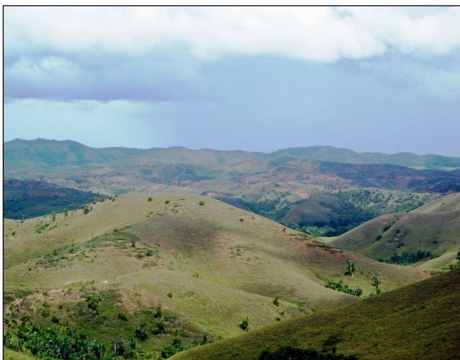
Dette er enorme områder som før var dekket av regnskog, men som nå likner mest på et månelandskap. Etter nedhugging vokser det ingenting her, fordi jorda er så mager. Det arbeides aktivt for å prøve å redde det som er igjen av regnskog på Madagaskar.