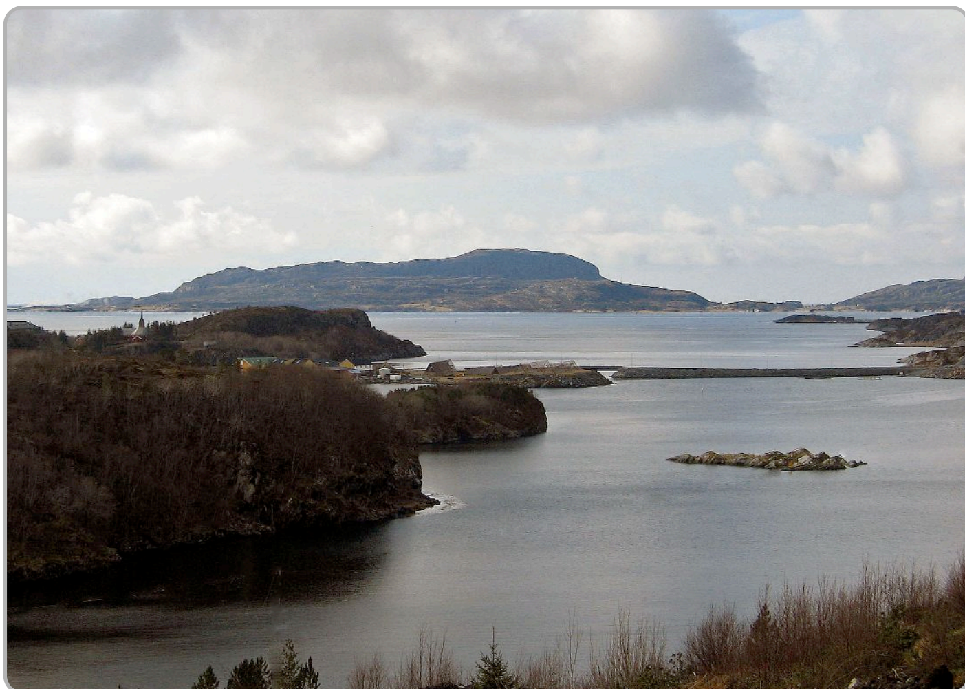
Utsikt mot Refsnes og Stoksund kirke - Linesøya i bakgrunnen.