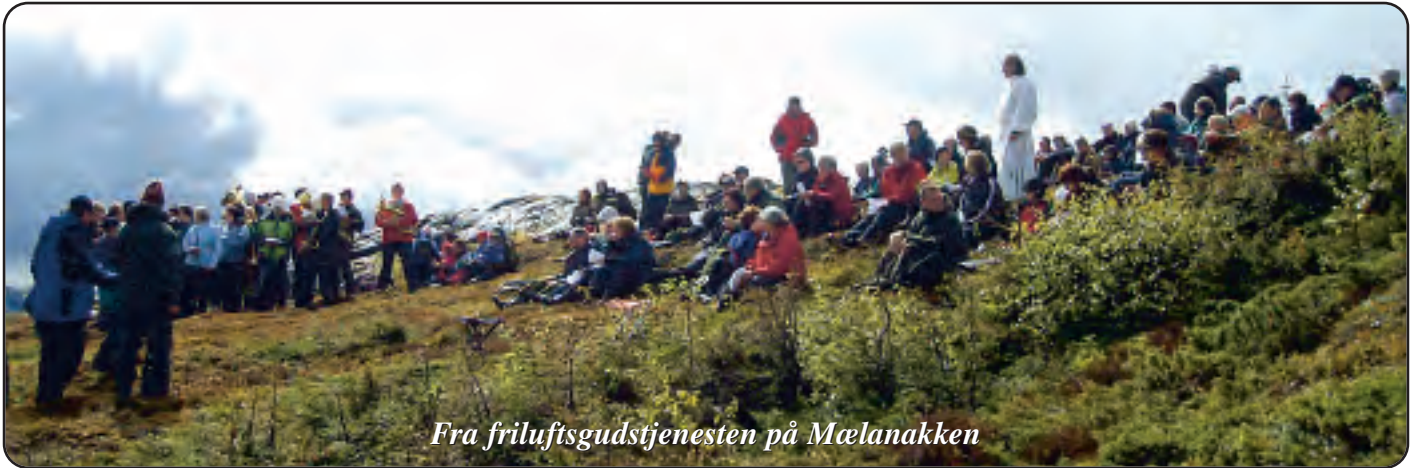
Fra friluftsgudstjenesten på Mælanakken