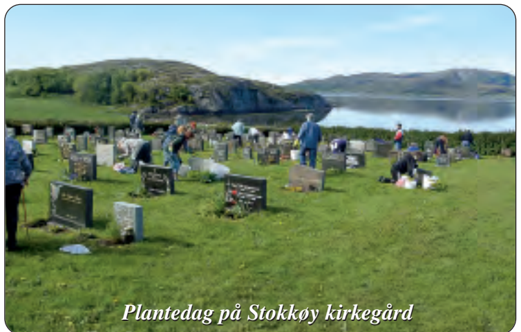
Plantedag på Stokkøy kirkegård