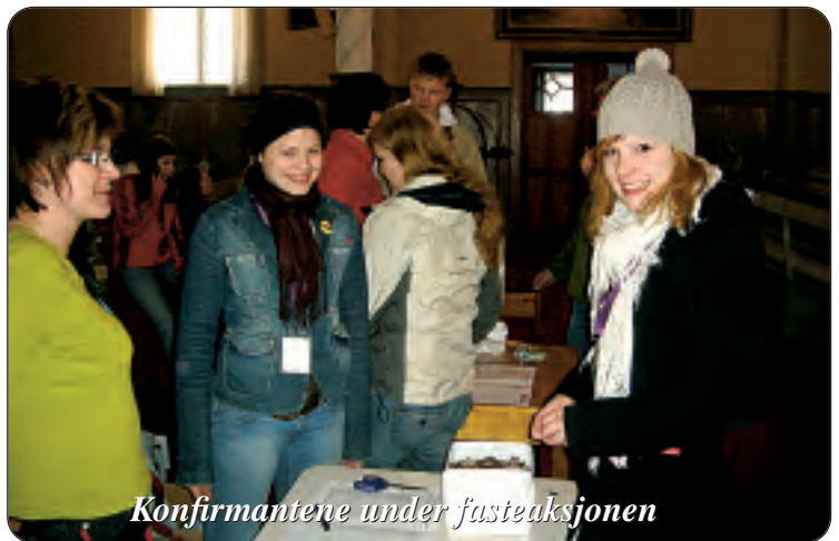
Konfirmentene under fasteaksjonen