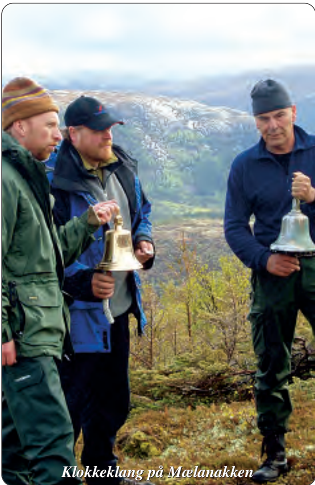
Klokkeklang på Mælanakken