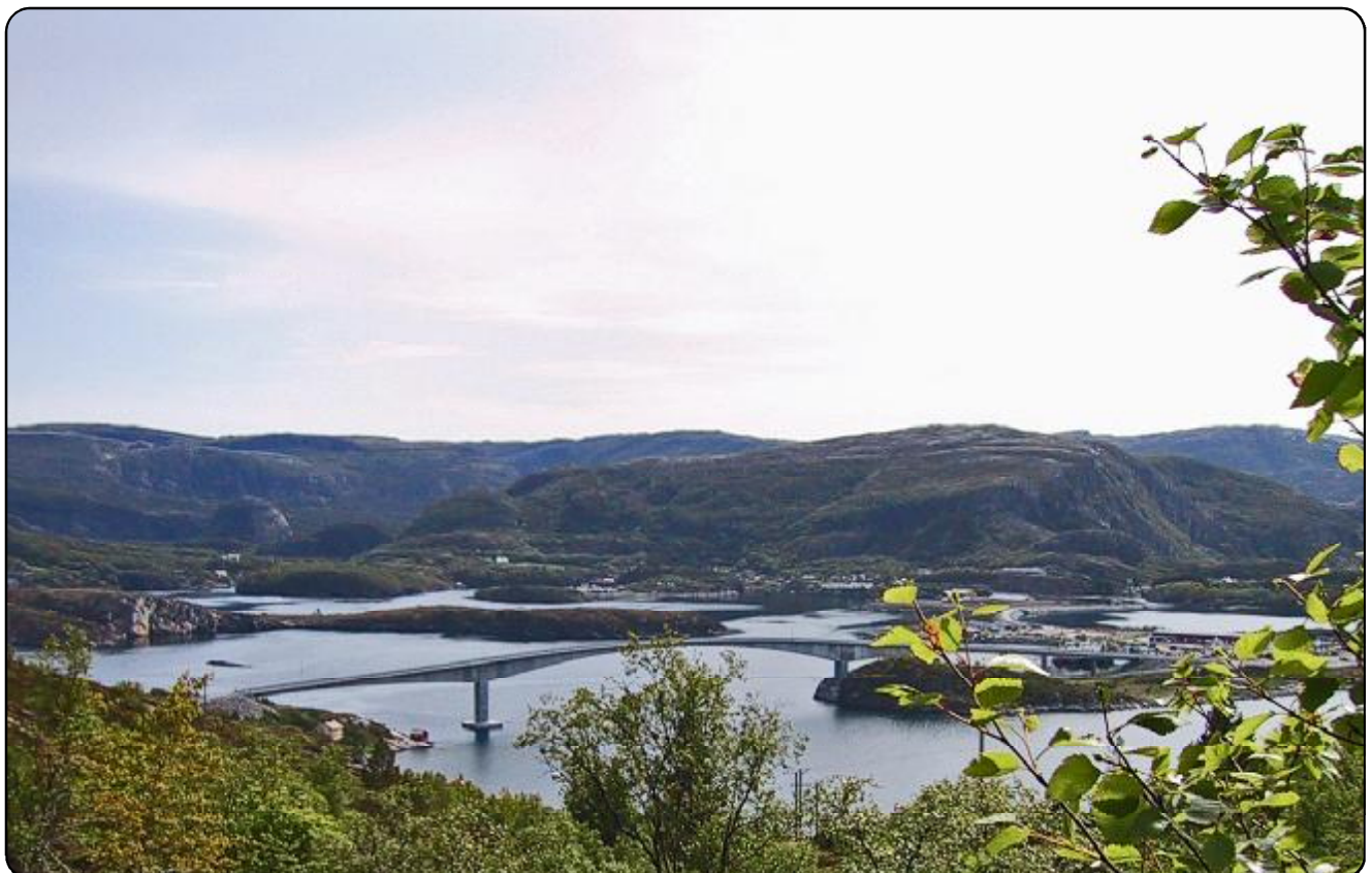
Utsikt mot Stokkøybrua og Refsnes

Innhold: Kirkevalget Konfirmanterne våre Fast stoff