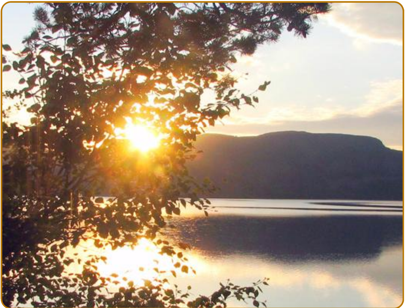
Soloppgang over Storvatnet i Sjørdalen