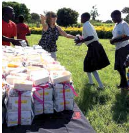
Ved å dele ut bind, truser og såpe blir det lettere for jentene å gå på skolen når de kommer i puberteten.